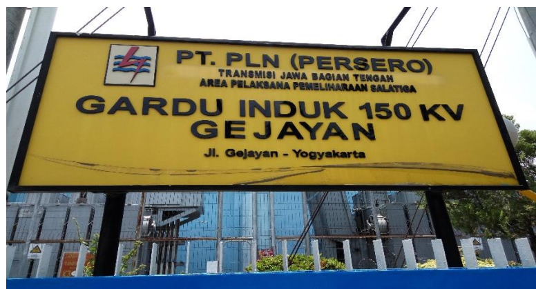
Gambar 3.1 Gardu Induk 150 KV Gejayan

Adapun lokasi yang dipilih sebagai lokasi dalam penelitian dilaksanakan di PT.PLN (Persero) Yogyakarta Gardu Induk 150kv Gejayan yang berlokasi di Jalan Gejayan – Yogyakarta.