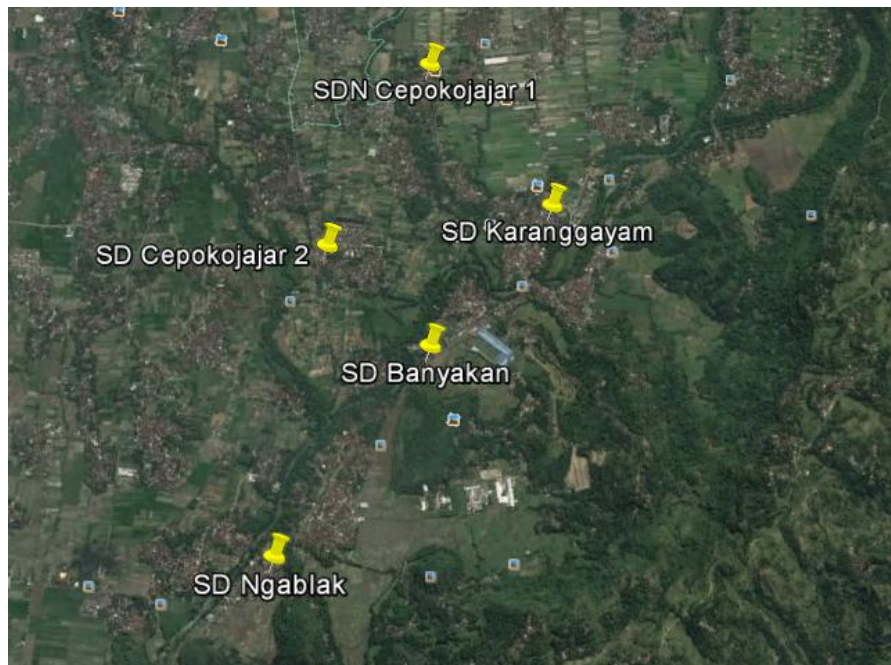
Gambar 4.1 Lokasi penelitian