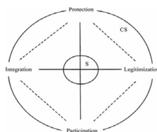
Gambar 1.1 Pola Hubungan Civil Society dengan Negara

Civil society adalah suatu masyarakat yang dipenuhi nilai-nilai keadaban ( civility ), dengan ciri-ciri: egalitarianisme, penghargaan terhadap orang berdasarkan prestasi, keterbukaan partisipasi seluruh anggota masyarakat secara aktif, kepatuhan terhadap norma dan hukum, toleransi, pluralisme, musyawarah dan penegakan hukum dan keadilan (Madjid, 1996:51-55)[5]. Muller (2006) [6] menggambarkan pola hubungan civil society dengan negara sebagai berikut: