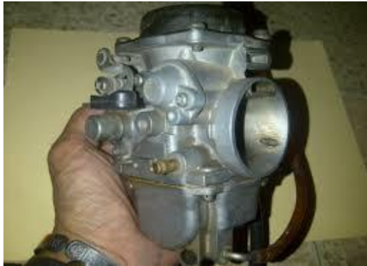
Gambar 2.2. Karburator