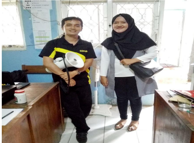
Dokumentasi wawancara dengan ibu-ibu pengumpul batu di RW 1 Desa Karanggedang