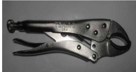
Gambar 3 .2 Tang Jepit

Untuk menjepit atau memindahkan benda-benda yang panas yang memperoleh panas dari hasil pemotongan dan pengelasan. Takai tang biasanya diisolasi.