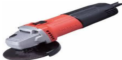
Gambar 3 .1 Gerinda Tangan

Untuk memotong bahan sesuai ukuran yang diinginkan dan menghaluskan sisa potongan.