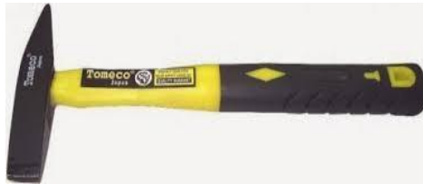
Gambar 3. 4 Palu Las

untuk memukul benda keras, karena akan mengakibatkan kerusakan pada bentuk ujung palu sehingga palu tidak bisa berfungsi sebagaimana mestinya.