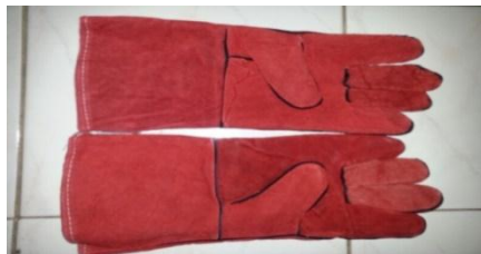
Gambar 3 .6 Sarung Tangan

Sarung tangan berfungsi untuk melindungi tangan.