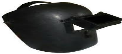
Gambar 3 .7 Topeng Las

benda panas lainnya. Juga untuk melindungi muka operator las terhadap percikan hasil pemotongan, dan ledakan percampuran gas yang tidak sempurna.