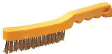
Gambar 3. 3 Sikat Kawat

Sikat kawat berfungsi membersihkan benda kerja yang akan di las dan sisa-sisa terak yang masih ada setelah dibersihkan dengan palu terak. Sikat tersebut biasanya terbuat dari kawat-kawat baja yang tahan panas dan elastis, dengan tangkai yang terbuat dari kayu dan dapat mengisolasi panas.