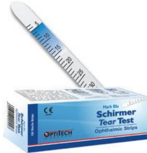
Gambar 11. Schirmer Tear Test Strip