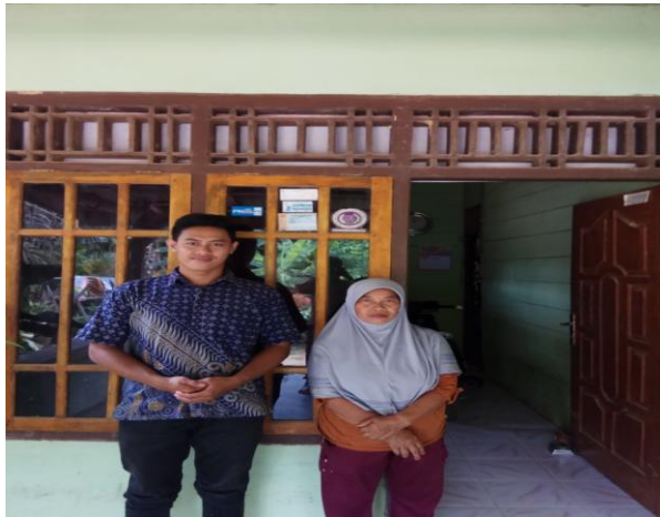
Wawancara dengan IRM