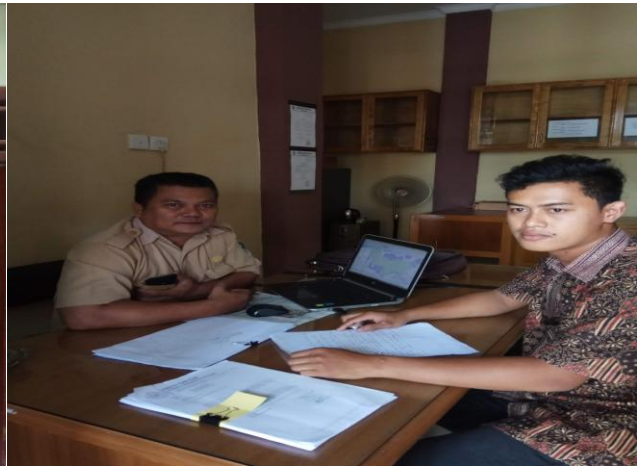
Wawancara dengan IRP