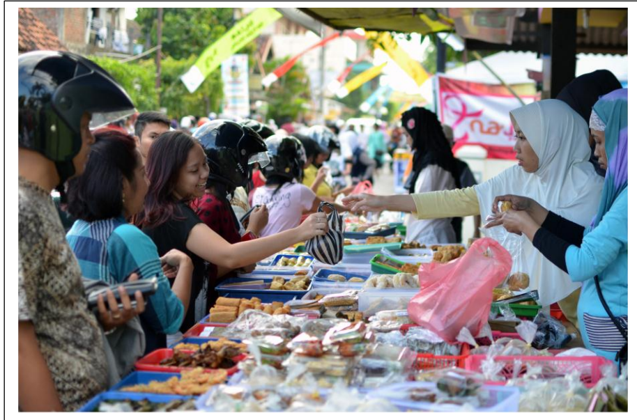
Pasar Sore Bulan Ramadhan