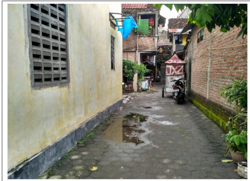
Salah satu lokasi yang berisi beberapa rumah warga yang menjadi responden penelitian