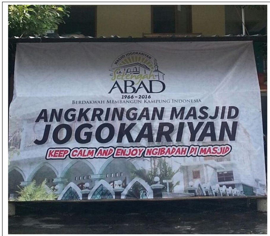
Angkringan Masjid Jogokariyan, salah satu usaha masyarakat yang mendapatkan bantuan modal dari Masjid Jogokariyan