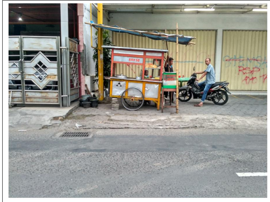
Warung bakso milik salah satu warga Masjid Jogokariyan yang mendapatkan bantuan modal dari Masjid Jogokariyan