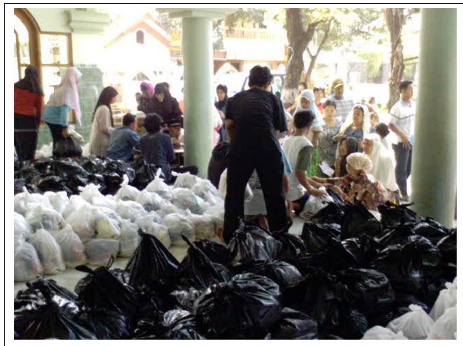
Kegiatan Pembagian Sembako Untuk Para Dhuafa