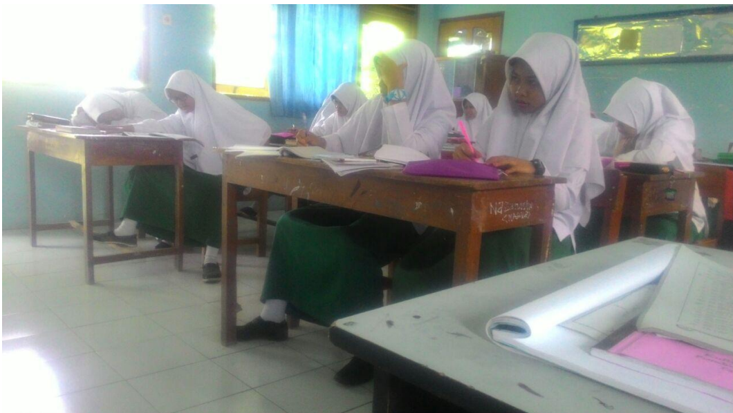
Gambar 2 adalah kegiatan belajar mengajar di Pondok Pesantren Ibnul Qoyyim Putri Yogyakarta.