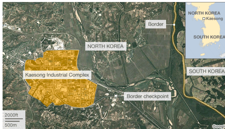
Gambar 1.1 Peta Komplek Industri Kaesong.