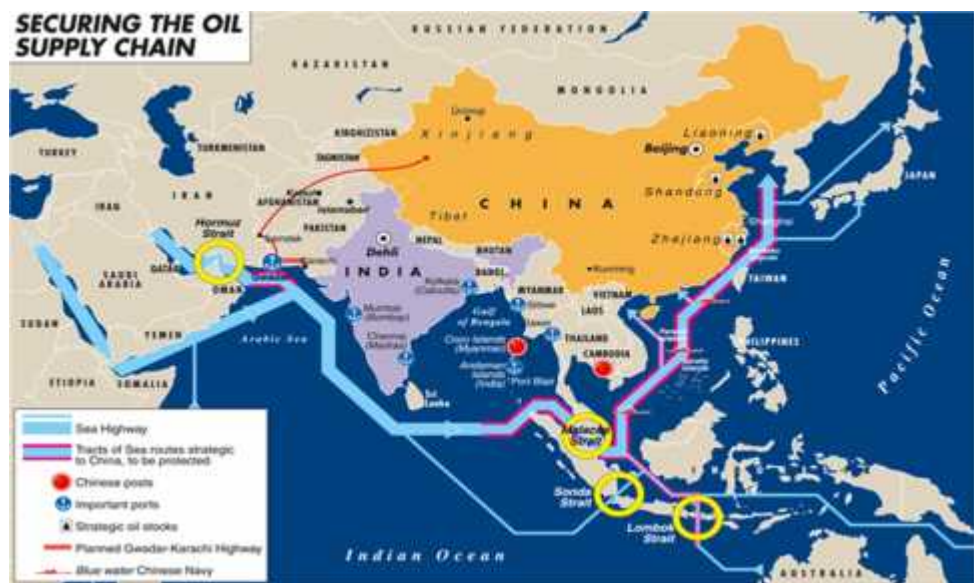
Gambar IV B.2 Jalur Perdagangan Dunia

(SLOC)" secara politik dan ekonomi sangat strategis karena menyangkut kelangsungan hidup sejumlah negara di mana empat di antara perairan tersebut berada dalam kedaulatan Indonesia. Jalur transportasi laut tersebut merupakan bentangan garis energi minyak dan gas bumi yang tidak boleh terputus karena hal tersebut sangat berkaitan dengan industri negara-negara maju (Trendezia, 2016). Oleh karena itu, Indonesia menjadi salah satu negara yang paling strategis, karena industri-industri besar mengandalkan jalur perdagangan indonesia.