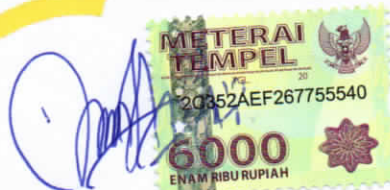
Melysa Ekapaksi Pradewi