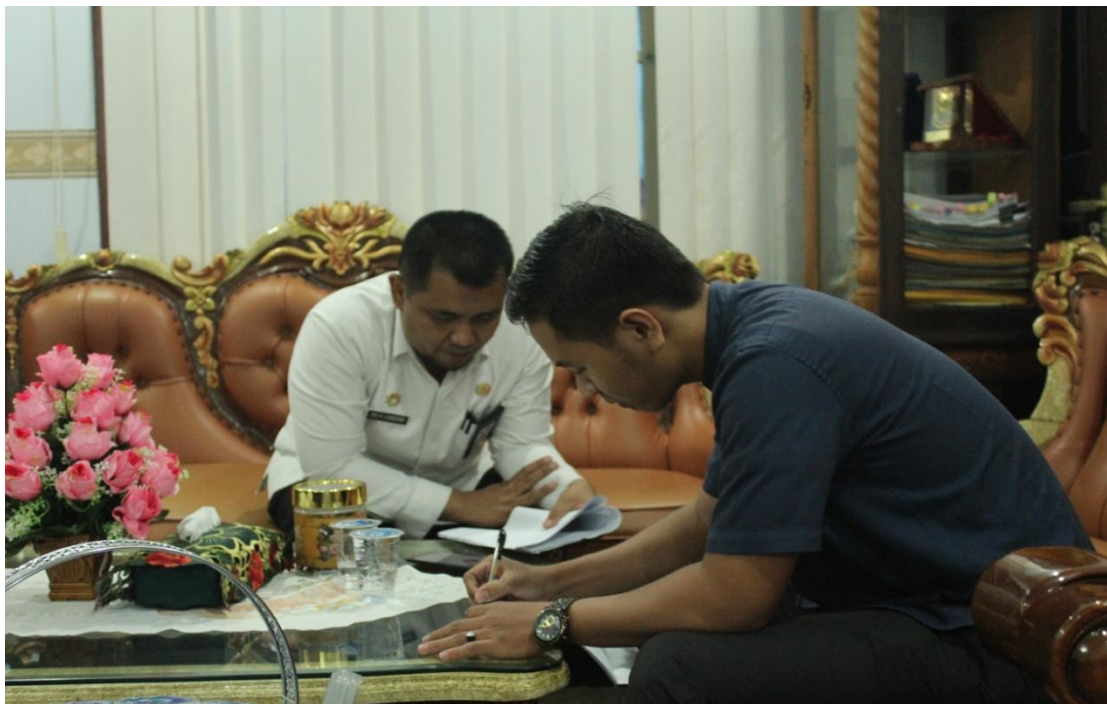
Pengambilan data (wawancara) dengan Kepala Dinas DPKAD Kota Kotamobagu