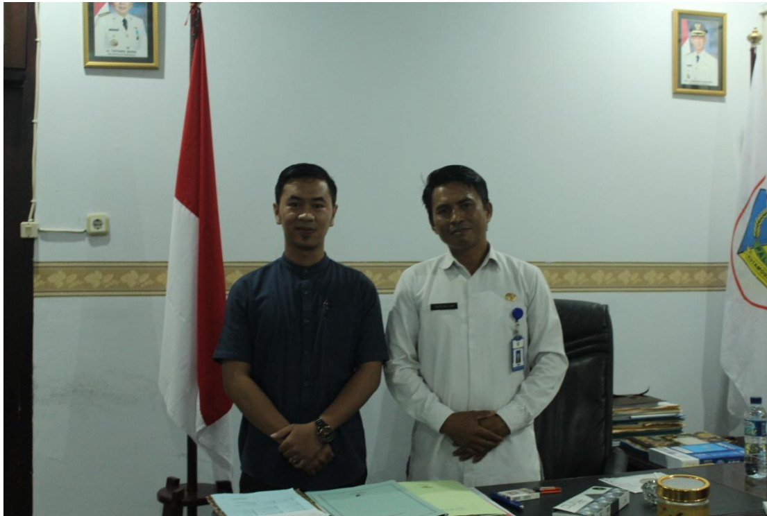
Pengambilan data (wawancara) dengan Sekretaris Daerah Kota Kotamobagu