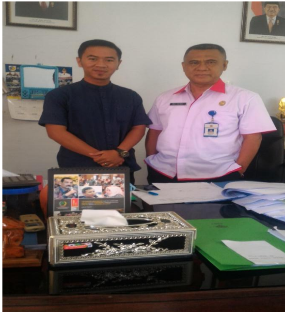
Pengambilan data (wawancara) dengan Sekretaris Dewan Kota Kotamobagu