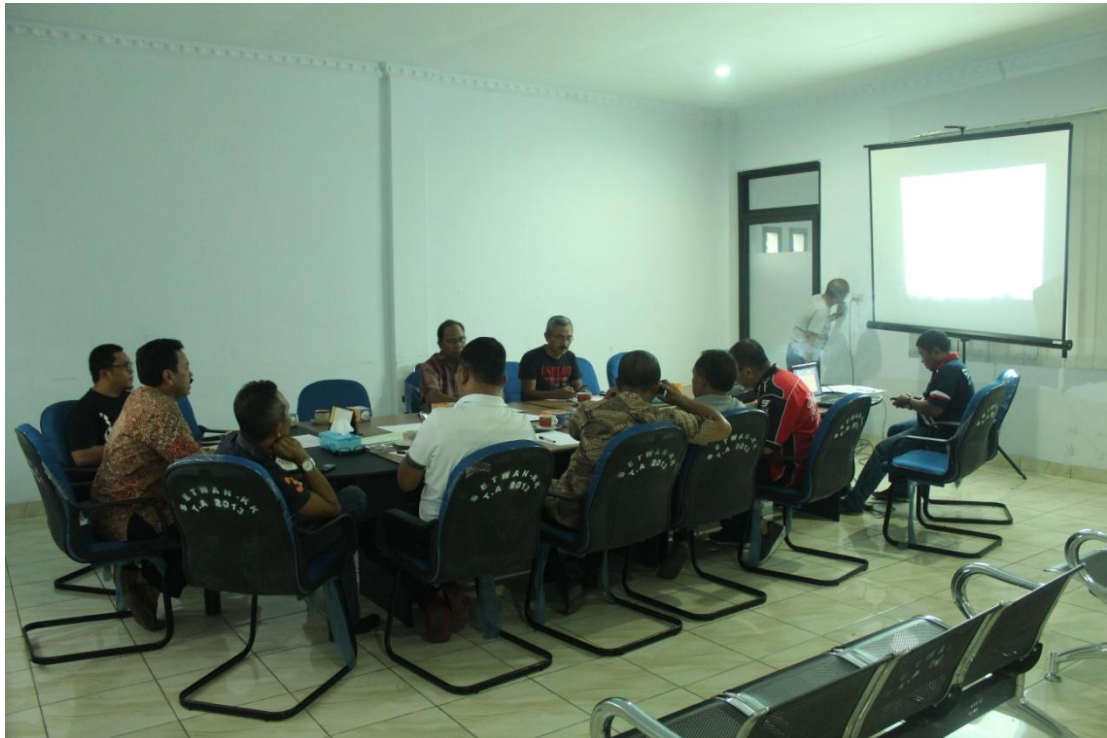
Rapat Pembahasan Ranperda Baleg DPRD Kota Kotamobagu