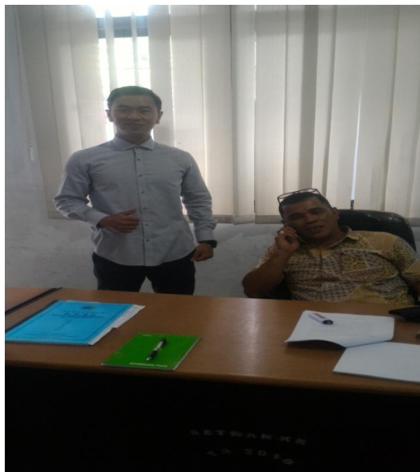
Pengambilan data (wawancara) dengan Sekretaris Komisi III DPRD Kota Kotamobagu