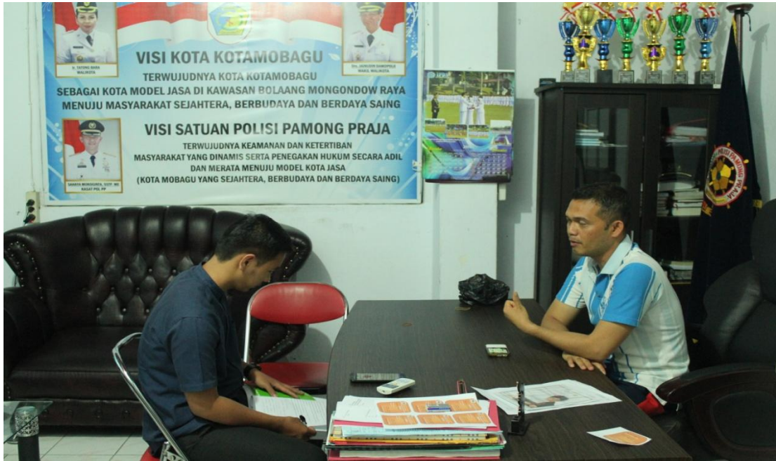
Pengambilan data (wawancara) dengan Kepala Satuan Polisi Pamong Praja