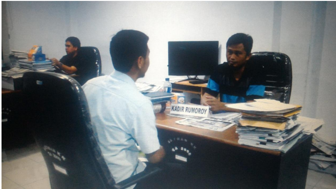
Pengambilan data (wawancara) dengan Ketua Komisi I DPRD Kota Kotamobagu