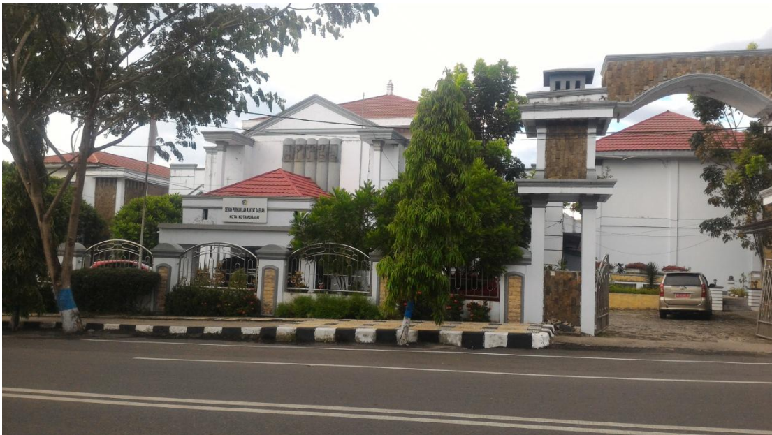
DPRD Kota Kotamobagu