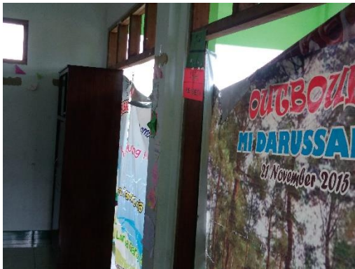
Gambar 20 Kerusakan pada jendela