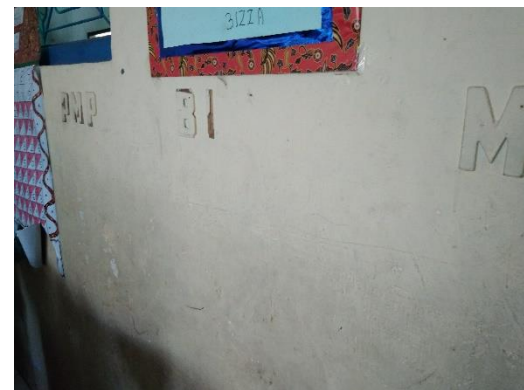
Gambar 9 Cat dinding rusak