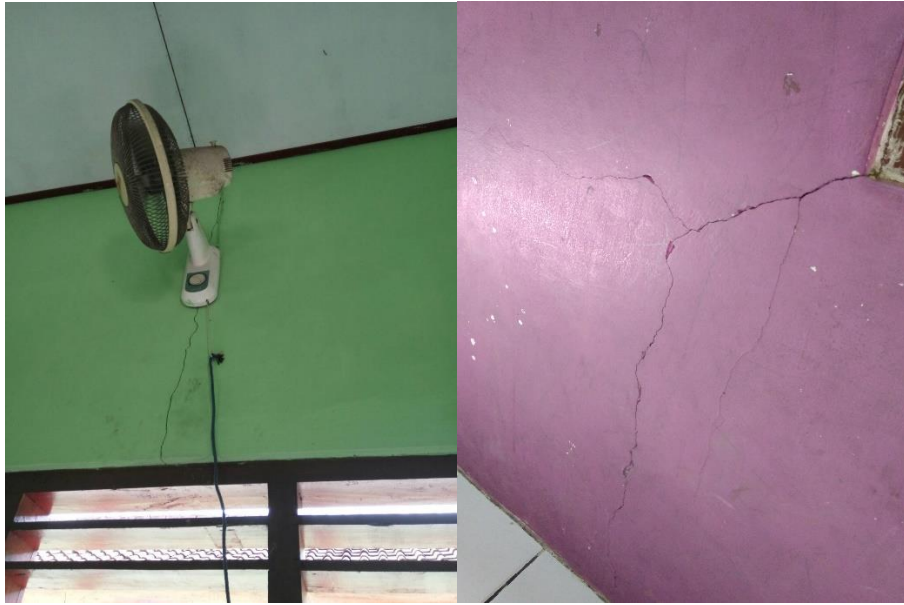
Gambar 16 Dinding retak