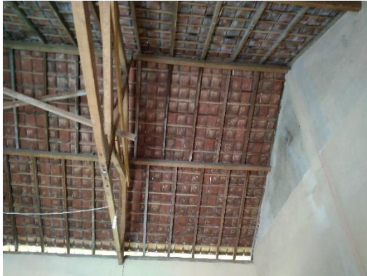
Gambar 6 Kerusakan plafon