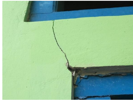
Gambar 2 Kerusakan dinding