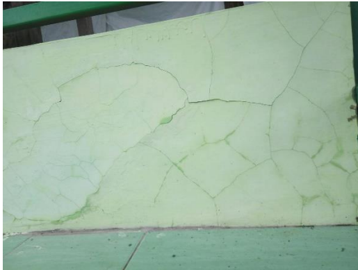
Gambar 18 Retak pada sloof