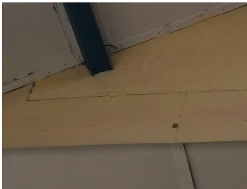
Gambar 3 Kerusakan balok