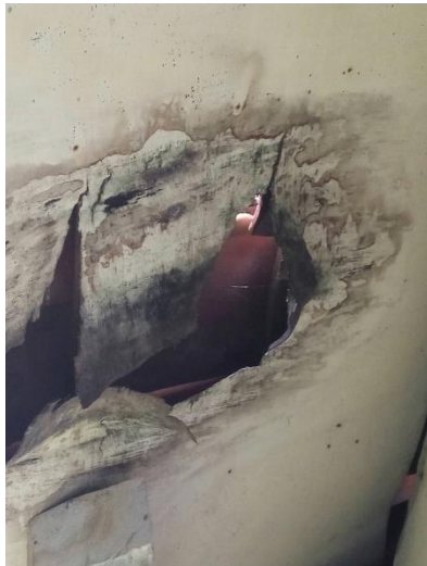
Gambar 13 Kerusakan pada plafon