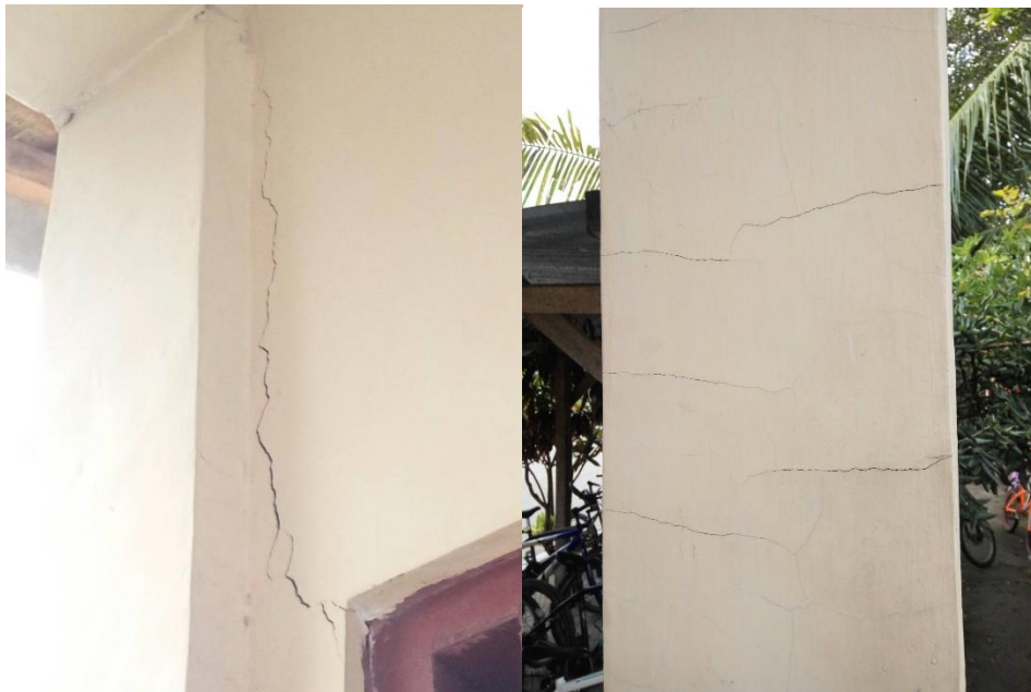
Gambar 17 Retak pada sambungan kolom ke dinding dan retak pada kolom