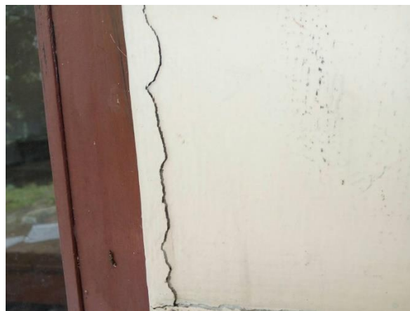
Gambar 15 Sambungan dinding ke pintu rusak