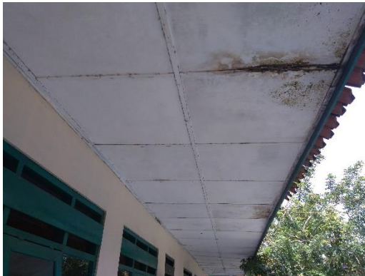
Gambar 11 Cat plafon rusak