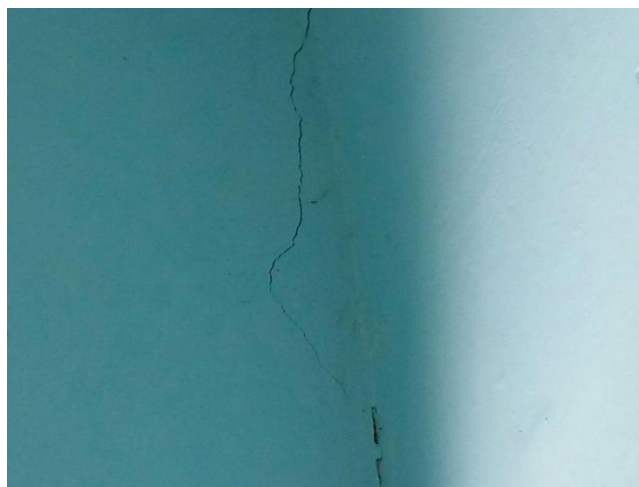
Gambar 10 Sambungan dinding kekolom rusak