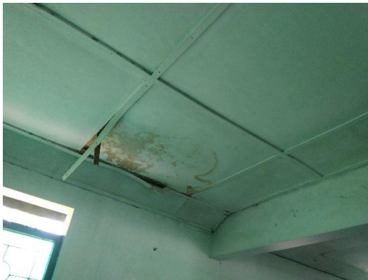
Gambar 8 Rangka plafon rusak