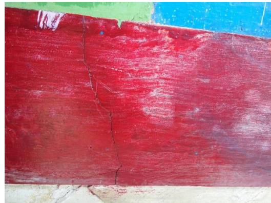
Gambar 4 Kerusakan pada dinding