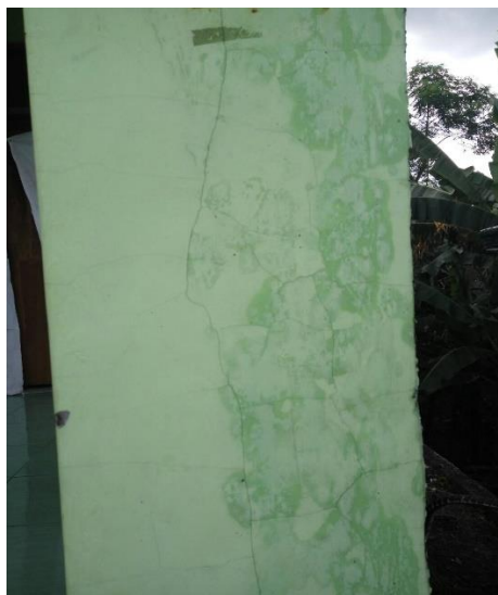
Gambar 22 Retakan pada kolom