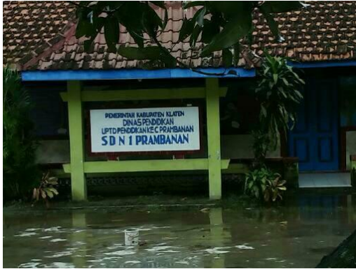
Gambar 1 Tampak depan