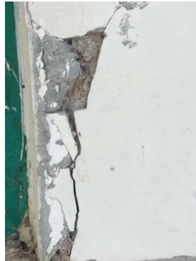
Gambar 14 Dinding retak