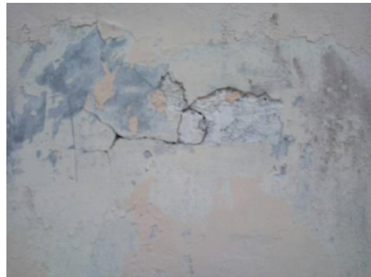
Gambar 12 Cat tembok rusak