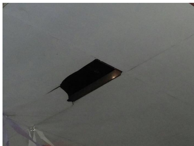
Gambar 5 Kerusakan pada plafon