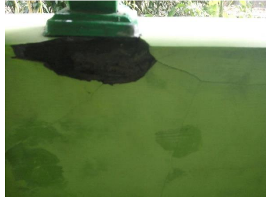
Gambar 21 kerusakan pada dinding