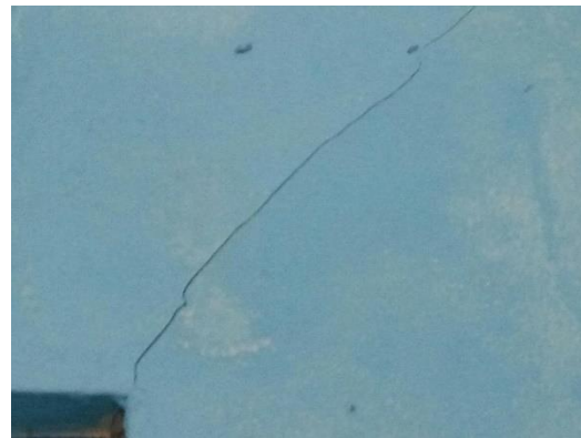
Gambar 7 Dinding retak