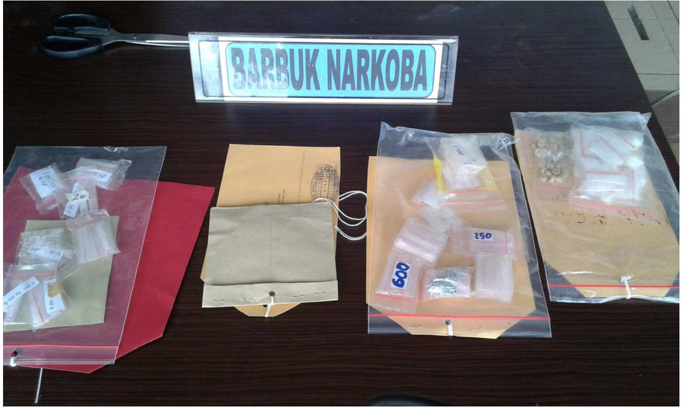
FOTO PEMUSNAHAN BARANG BUKTI