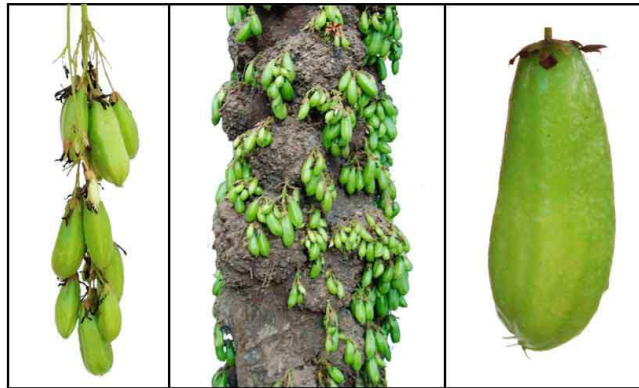
Gambar 2. Tanaman Belimbing Wuluh (Roy et al. , 2011)

Belimbing wuluh memiliki nama yang berbeda untuk setiap daerah seperti : Limeng (Aceh), Selemang (Gayo), Asom belimbing (Batak), Malimbi (Nias), Blimbing Wuluh (Jawa), Bhalingbing Bulu (Madura), Blingbing Buloh (Bali), Calene (Calene) dan Malibi (Halmahera) (Muhlisah, 2000).