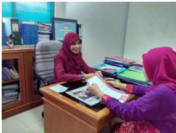
Gambar 3 : Wawancara dengan kaprodi DIII Kebidanan Universitas Aisyiyah Yogyakarta