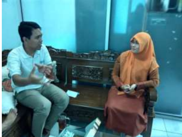
Gambar 1 : Wawancara dengan kaprodi DIII Kebidanan STIKES Aisyiah Surakarta