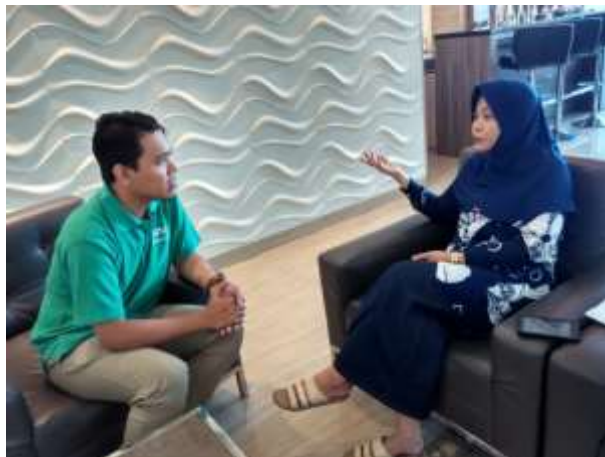
Gambar 2 : Wawancara dengan kaprodi DIII Kebidanan Unimus Semarang