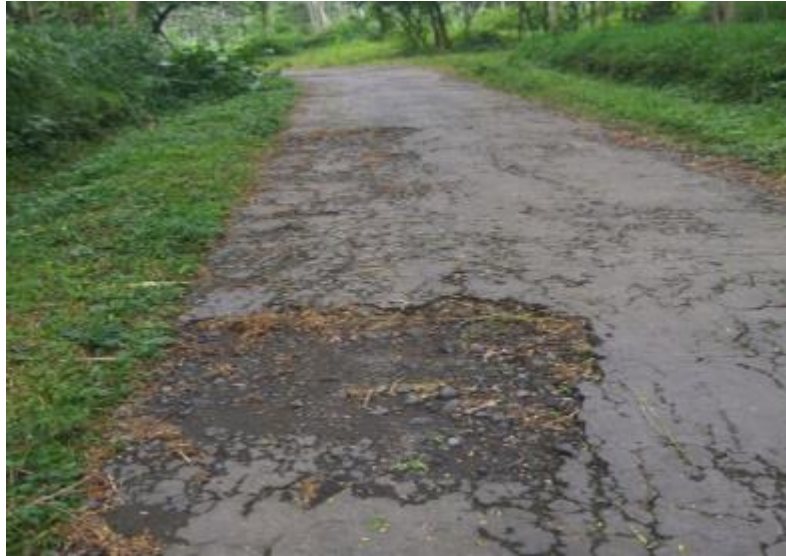
Gambar 3. Jalan dengan kondisi rusak