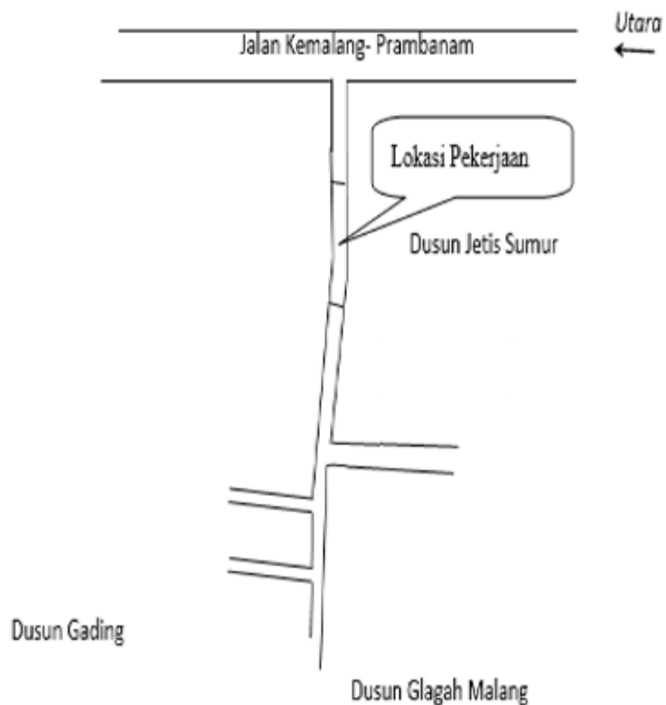
Gambar 1. Denah Lokasi Jalan Dusun Jetis Sumur.

Dusun Jetis Sumur, Desa Glagaharjo, Kecamatan Cangkringan, Kabupaten Sleman, Daerah Istimewa Yogyakarta merupakan dusun yang berbatasan dengan Kabupaten Sleman, Daerah Istimewa Yogyakarta dan Kabupaten Klaten, Jawa Tengah. Dusun ini memiliki sebuah jalan utama yang setiap hari dilalui oleh warga, bukan hanya warga Dusun Jetis Sumur saja, melainkan juga sebagai jalan masuk menuju Dusun Glagah Malang dan Dusun Gading, seperti yang ditunjukkan pada Gambar 1.