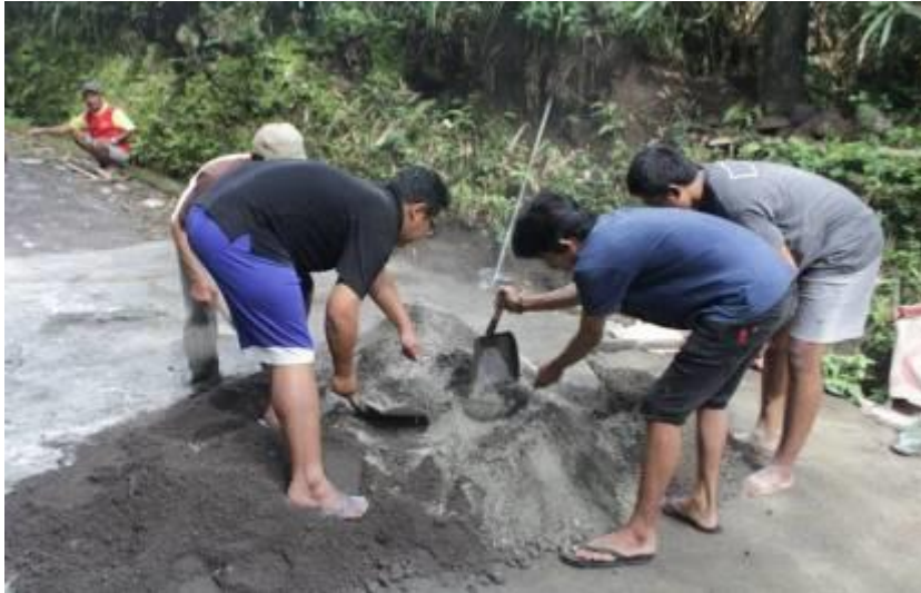
Gambar 5. Mahasiswa Teknik Sipil UMY ikut membantu dalam pelaksanaan perbaikan jalan.