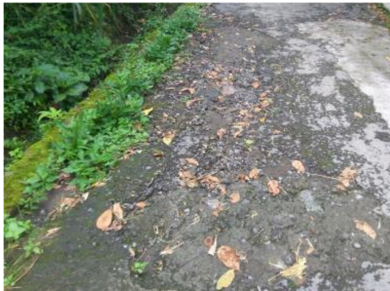
Gambar 2. Jalan dengan kondisi rusak.

Berdasarkan pertimbangan bahwa masyarakat Dusun Jetis Sumur sangat membutuhkan bantuan keahlian di bidang teknik sipil namun kondisi keuangan yang dimiliki terbatas, maka tim dari Program Studi Teknik Sipil FT UMY yang terdiri dari dosen dan mahasiswa telah melakukan kegiatan pengabdian kepada masyarakat berupa pendampingan dalam pelaksanaan perbaikan jalan yang rusak tersebut.