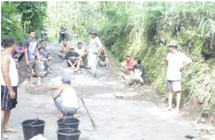
Gambar 6. Gotong royong warga saat melaksanakan perbaikan jalan.