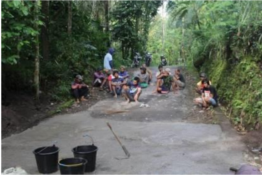
Gambar 7. Beristirahat setelah perbaikan jalan selesai.