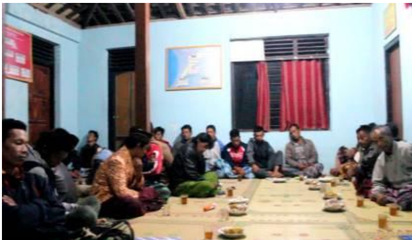
Gambar 4. Pertemuan dengan warga Dusun Jetis Sumur.

Kegiatan diawali dengan pertemuan bersama warga Dusun Jetis Sumur untuk membahas rencana perbaikan jalan yang rusak (Gambar 4).