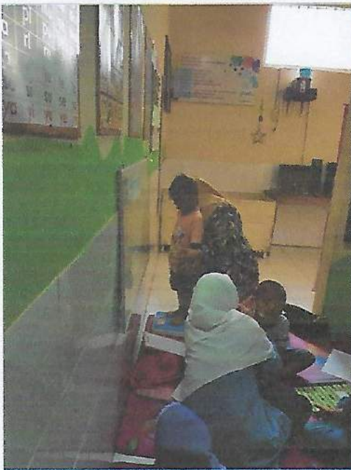
Gambar Pengukuran TB