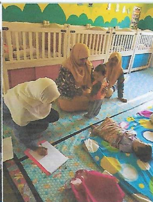
Pemeriksaan Fisik usia 1 tahun