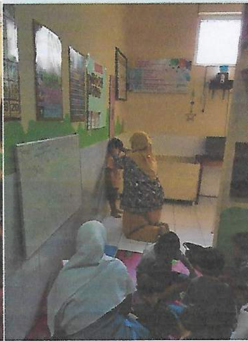
Gambar pengukuran Tinggi Badan