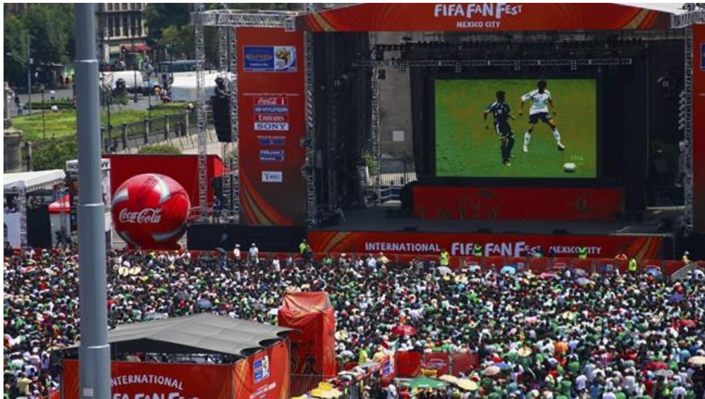
Gambar 3 FIFA Menggelar Nonton Bareng menjadi Salah Satu Sumber Pendapatan