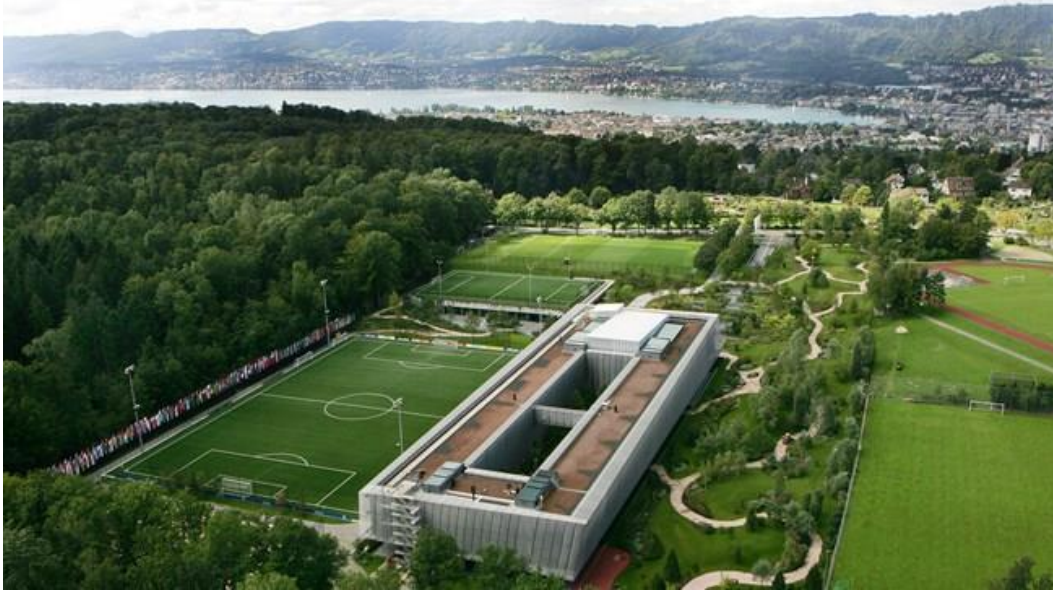
Gambar 1 Markas FIFA di Swiss