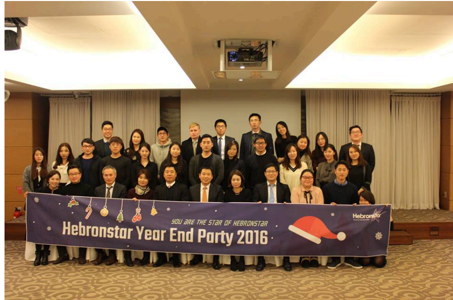
1.5 Event YEPY 2016 di Hotel Amaroosa Jakarta (27 desember 2016)