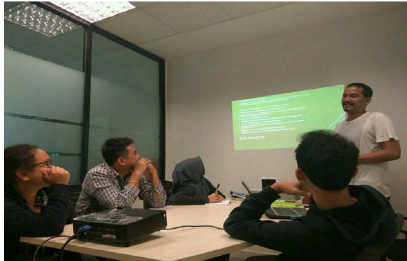
1.3 Evaluasi kegiatan bulanan tim divisi 3 (13 Oktober 2016)