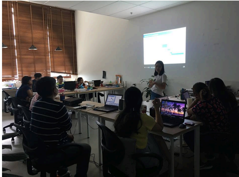
1.1 Ketua divisi 3 memberikan penjelasan mengenai project event GCA-Biz Matching Program 2016 (13 September 2016)