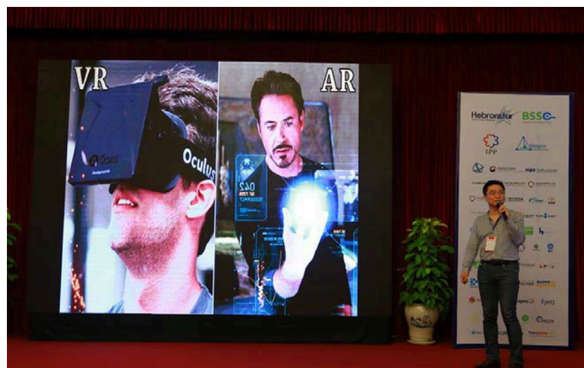
1.4 Dokumentasi Buyers Pada event GCA-Biz Matching Program 2016, Klien sedang mempresentasikan produk mereka (27 Oktober 2016)