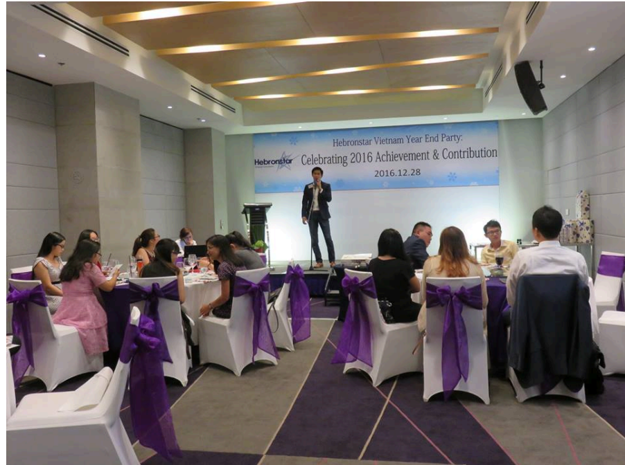
1.7 YEPY 2016 di Vietnam (28 Desember 2016)