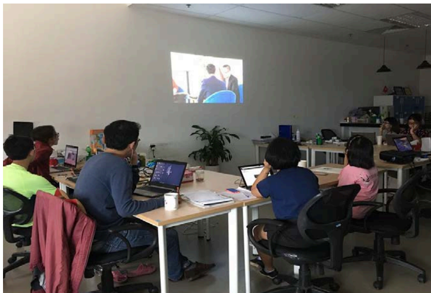
1.2 Suasana Tim Pelayanan Komplain (5 Oktober 2016)