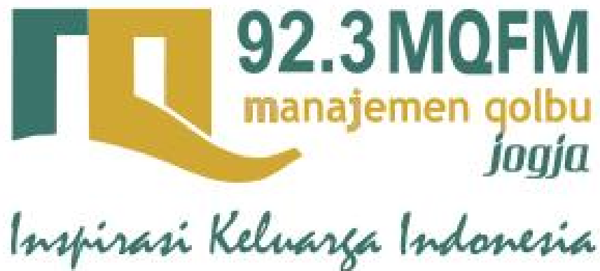
Gambar 2.1 Logo Radio 92,3 MQ FM Yogyakarta