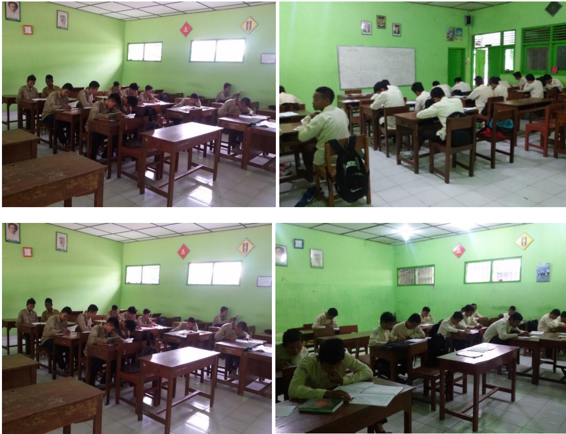
Gambar 1. Responden kelas X