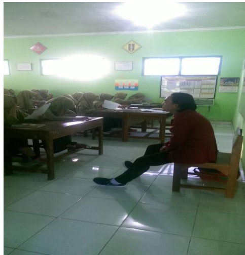
Gambar 4. Uji validitas