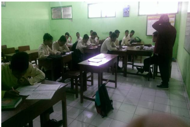
Gambar 5. Izin kepada guru mapel untuk melakukan penelitian