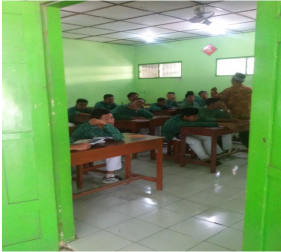
Gambar 3. Sebelum kegiatan baca Al-Qur'an