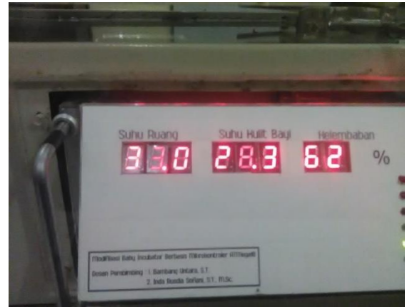
Gambar 2. Display Pada Alat

Setelah data dari sensor diolah oleh microcontroller , kemudian data tersebut akan ditampilkan pada display seven segment berupa nilai presentase Relatif Humidity (RH).