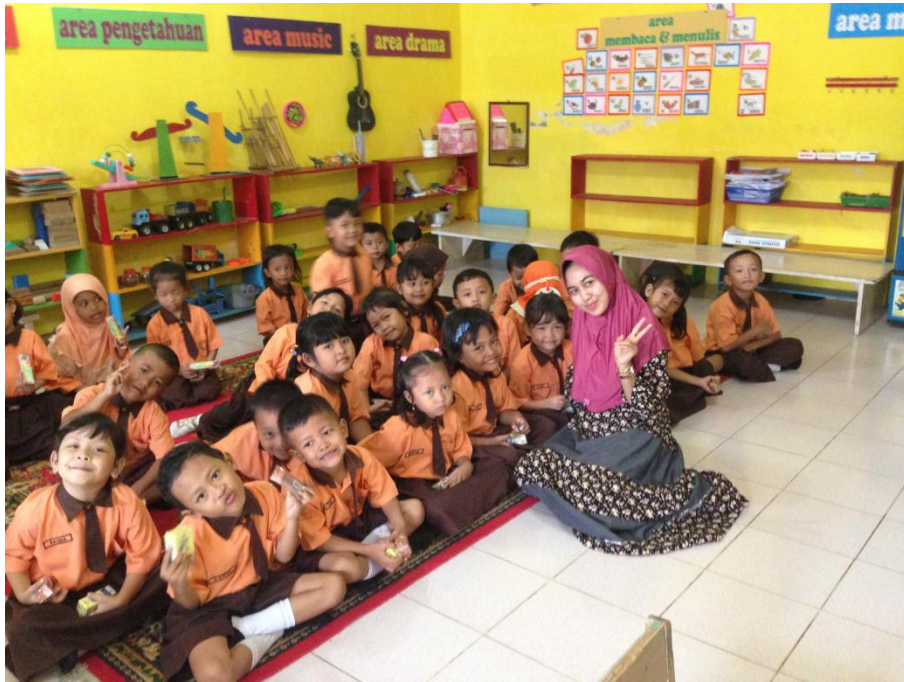
Lampiran 8. Foto