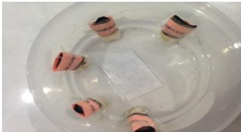
( Gigi saat direndam larutan hidrogen peroksida 3%)