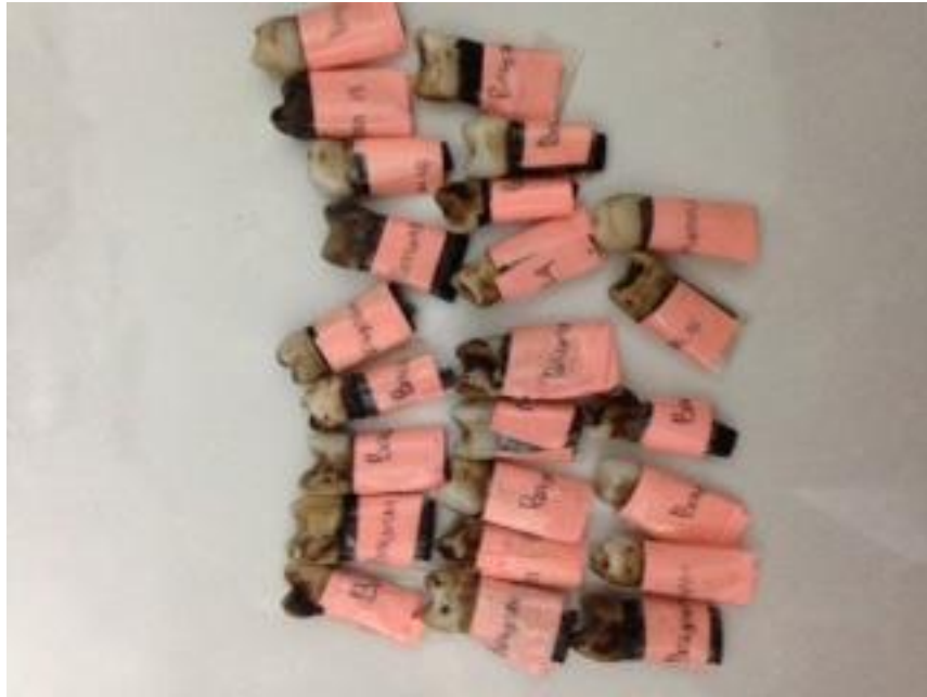
( Gigi setelah dilakukan proses diskolorisasi)