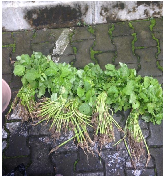
( Bayam sebelum dilakukan ekstrak)