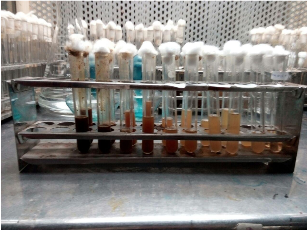
Lampiran 1 : Pengujian Dilusi Cair Sebelum Diinkubasi