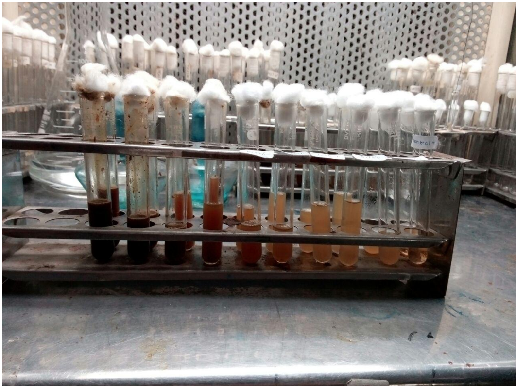
Lampiran 2 : Hasil Pengujian Dilusi Cair Setelah Diinkubasi