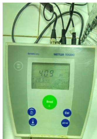
Gambar 4. 2 PH Meter Mettler Toledo

Pengujian alat ini dilakukan di Laboratorium Farmasi dan Farmakologi Fakultas Kedokteran dan Ilmu Kesehatan Universitas Muhammadiyah Yogyakarta. Pada analisa pengujian terdapat parameter yang akan diujikan yaitu nilai pH yang akan dibandingkan dengan alat pH meter. Pengujian nilai pH ini bertujuan untuk memastikan kesesuaian nilai pH dari modul Tugas Akhir. Dimana setiap sampel akan dilihat hasilnya pada modul Tugas Akhir dan pembanding. Pengujian direncanakan dilakukan pengambilan data menggunakan 4 sampel dengan 10 kali pengujian. Sebelum melakukan pengujian pada larutan sampel, sebelumnya alat diuji menggunakan larutan buffer dengan nilai pH 4,01 dan 6,86 untuk memastikan apakah alat sudah sesuai dengan pH yang tertera. Berikut adalah tampilan dari alat pembanding yang dapat dilihat pada gambar 4.2 di bawah ini: