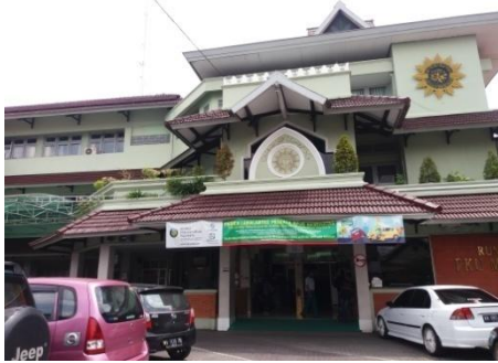
Depan RS PKU Muhammadiyah