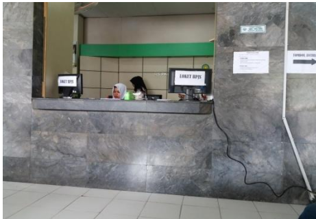
Tempat Pendaftaran Pasien Peserta BPJS