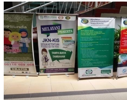
Spanduk Informasi tentang BPJS