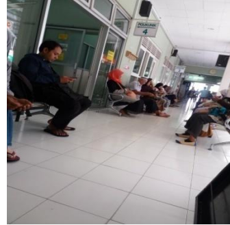
Loby Poliklinik RS PKU Muhammadiyah Yogyakarta