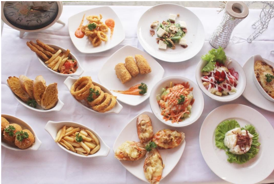
Gambar 1.3 beberapa menu makanan ringan khas Secret Garden Coffee and Chocolate (Sumber : Dokumentasi Instagram Secret Garden Coffee and Chocolate)

Gambar 1.2 Secret Garden Coffee and Chocolate dilihat dari sisi sebelah kiri, dalam suasana pada saat sore hari dan dari tengah Secret Garden Coffee and Chocolate pada suasana malam hari