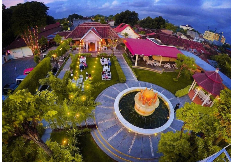
Gambar 1.1 Secret Garden Coffee and Chocolate dilihat dari atas, dalam suasana malam hari