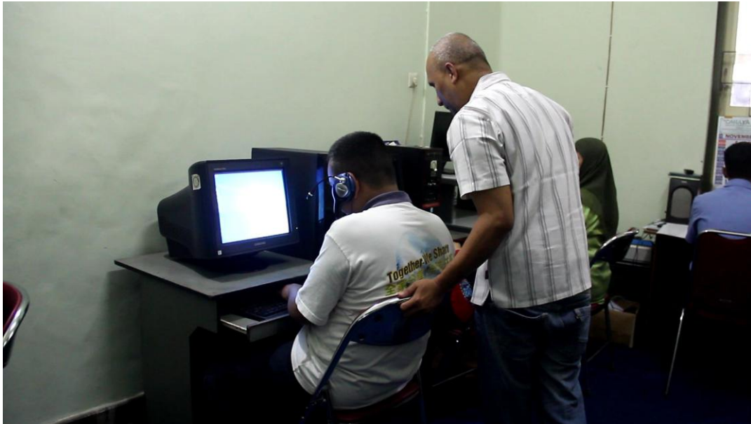
Gambar 1.3 Guru melihat hasil praktik masing-masing murid.