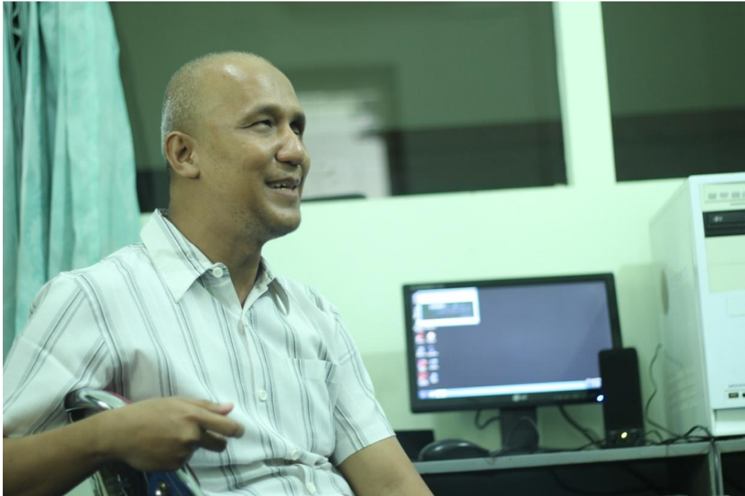
Gambar 1.1 Guru menjelaskan materi dengan ekspresi wajah yang ceria.