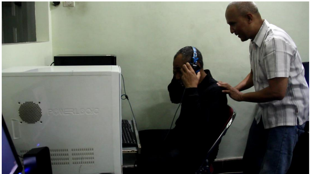
Gambar 1.1 Guru menjelaskan materi pada murid yang belum mengerti.