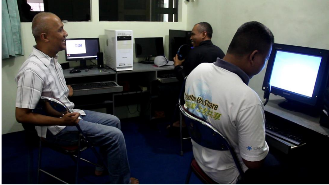
Gambar 1.5 Guru bercanda sehingga murid tertawa.