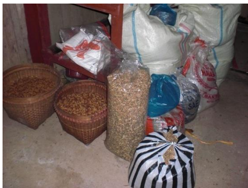
Gambar 2.2 Biji Mentah Kopi