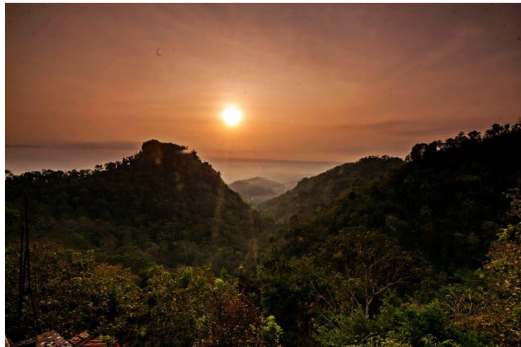
Gambar 2.5 Potensi Alam di Kampung Kopi Kerug Batur