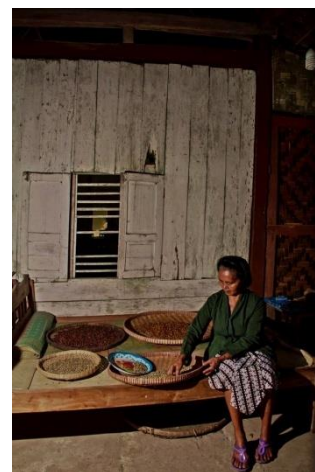
Gambar 2.3 Proses Pemilihan Biji Kopi