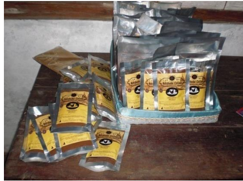
Gambar 2.5 Kemasan Kopi Borobudur