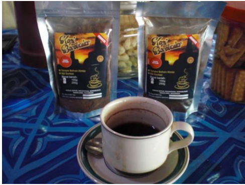
Gambar 2.4 Kemasan Kopi Borobudur Pertama