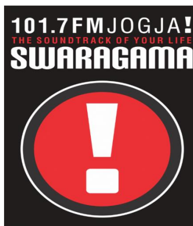
Gambar 2.4 Logo Swaragama 101.7 FM