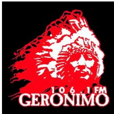
Gambar 2.1 Logo Geronimo 106.1 FM

Agar mudah dikenali, radio ini menampilkan sebuah logo yang sesuai dengan namanya yaitu Geronimo. Logo Geronimo diambil dari replika kepala suku Indian suku Apache yang bijaksana, gagah, berani dan jujur ( Company Profile Geronimo FM , 2016).