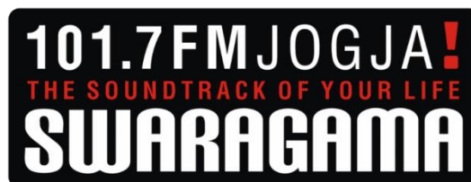
Gambar 2.5 Slogan Swaragama FM

Warna merah sebagai simbol semangat dan keberanian untuk tetap eksis dalam persaingan bisnis radio lokal maupun nasional. Warna putih sebagai simbol niat yang tulus untuk tetap menjadi media yang koperatif, bersih dan terus memberi kontribusi positif terhadap perkembangan masyarakat Yogyakarta. Warna hitam sebagai simbol ketegasan dalam berpikir, berkreasi , dan bertindak.