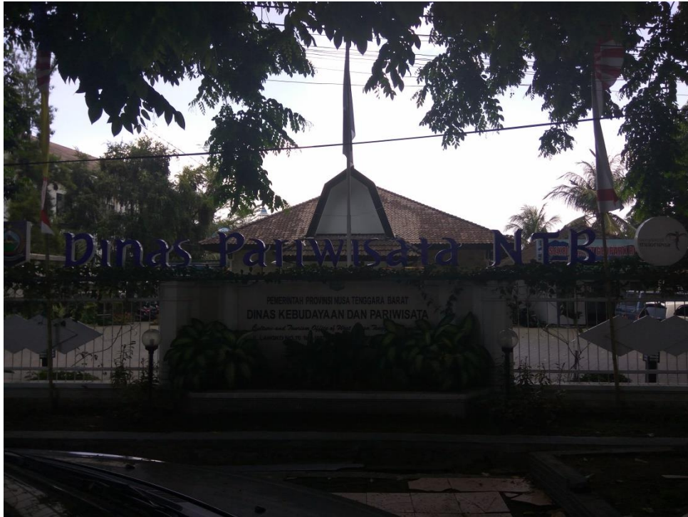
GAMBAR 5. KANTOR DINAS KEBUDAYAAN NTB