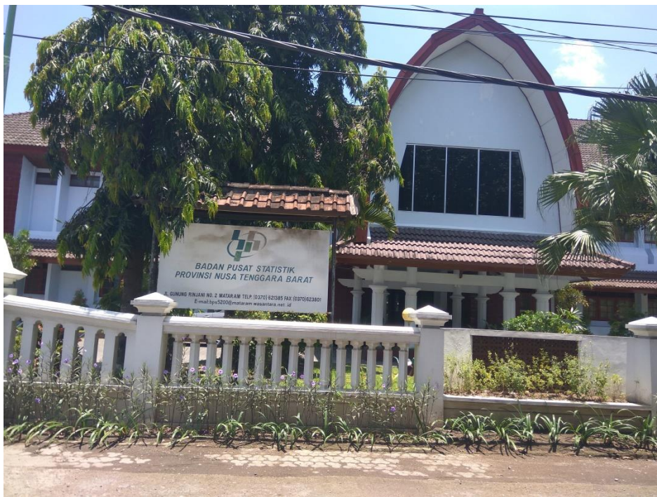
GAMBAR 4. BPS NTB