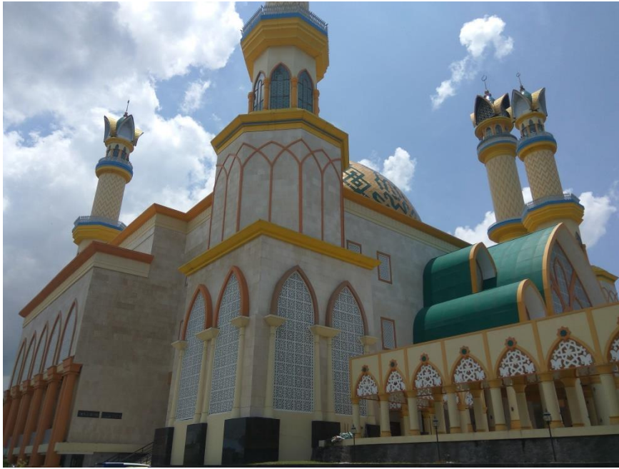
GAMBAR 3. ISLAMIC CENTER sekaligus MASJID AGUNG NTB