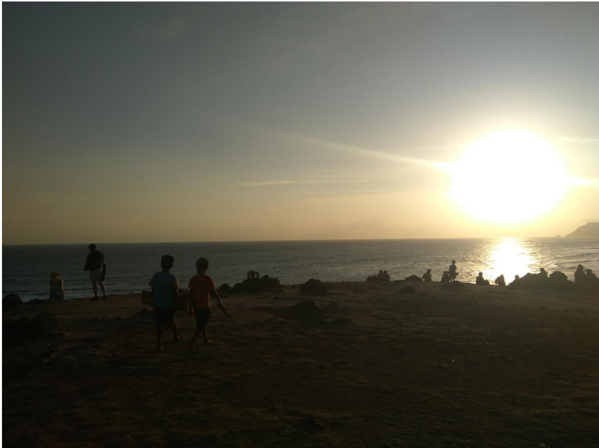
GAMBAR 14 dan 15 pantai KUTA MANDALIKA dan PANTAI TANJUNG AAN adalah salah satu spot pantai cantik di pulau LOMBOK NTB