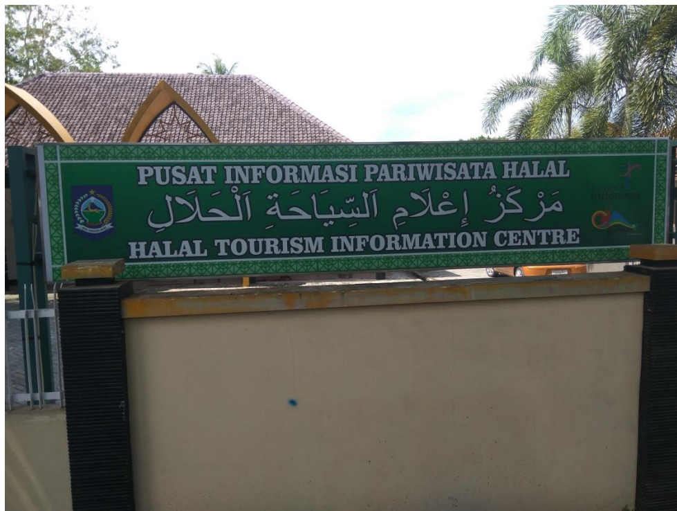
GAMBAR 6. KANTOR MUI NTB