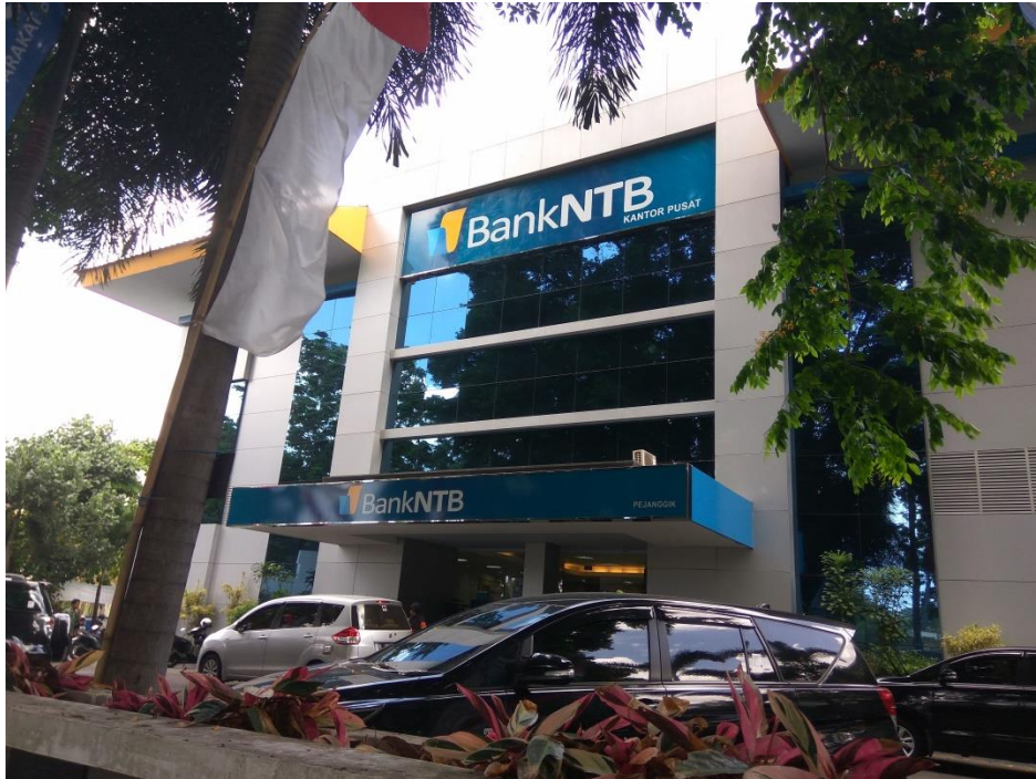
GAMBAR 7. KANTOR PUSAT BANK NTB ( KONVESIONAL DAN UUS)