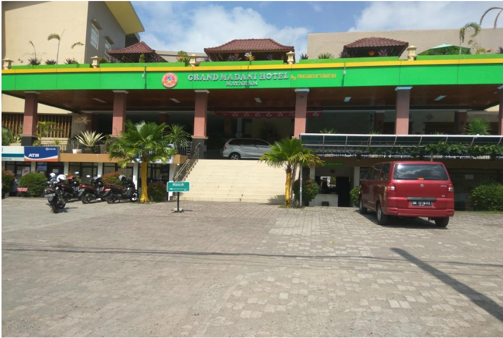
GAMBAR 9. Salah satu HOTEL SYARIAH di KOTA MATARAM tempat pengambilan data-data kuisisioner