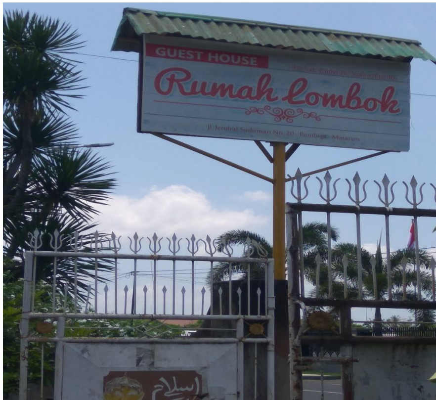
GAMBAR 8. Salah satu HOTEL SYARIAH "guest house" tempat wawancara dan pengambilan data kuisiner di kota MATARAM