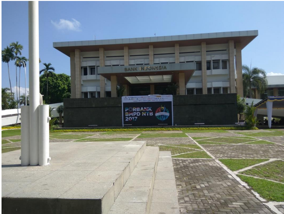
GAMBAR 1. KANTOR BI NTB