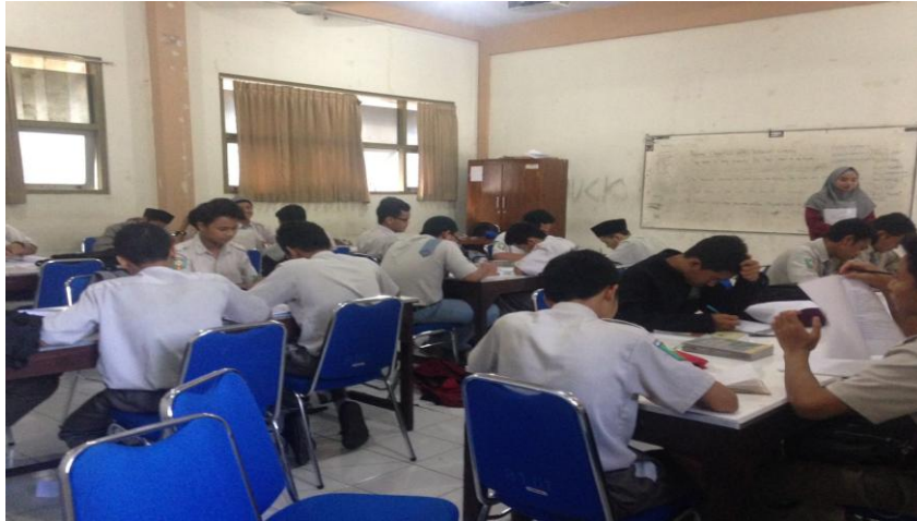
Foto Kegiatan Penyebaran Kuisisioner