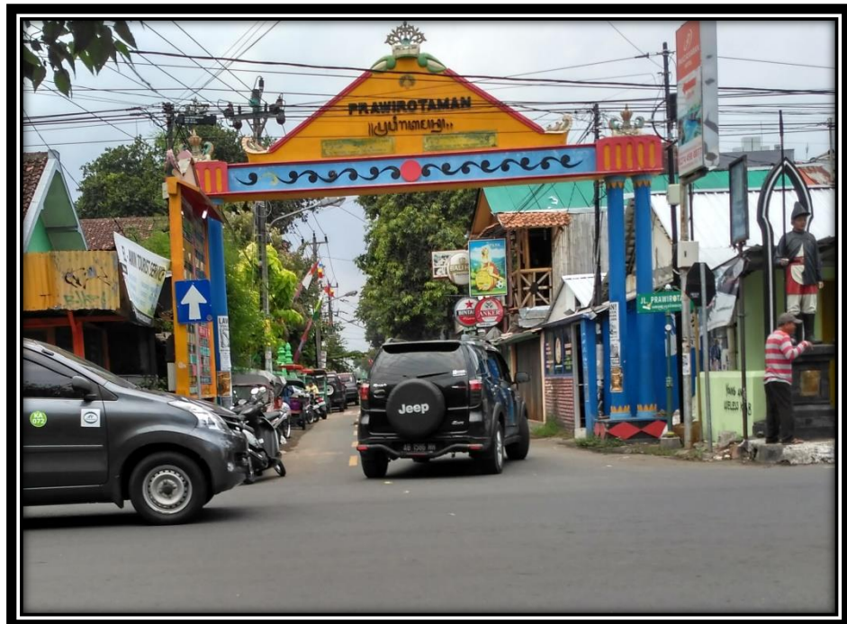
Gambar 4: Pintu Gerbang Kampung Prawirotaman 1

Prawirotaman II, dan RW 09 yang memiliki 5 RT disebut juga Prawirotaman III. Untuk penomoran RT di RW 08 dan 09 nomernya melanjutkan RW 07 dari 27 dan seterusnya. RW 07 Prawirotaman biasa disebut Prawirotaman I yang dilalui jalan yang disebut jalan Prawirotaman 1 (Wawancara bapak Sapto selaku Ketua RT 25, 26 Februari 2017).