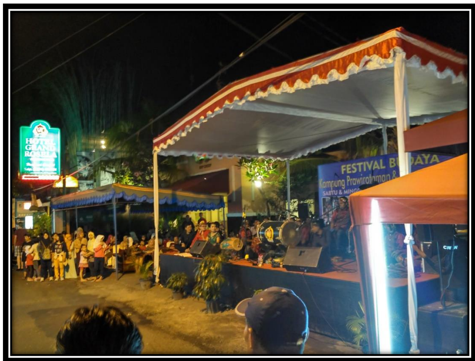
Gambar 5: Panggung Festival Budaya Kampung Prawirotaman

menyebut kampung Prawirotaman juga sebagai kampung wisata. Adanya kegiatan-kegiatan wisata yang ada di kampung Prawirotaman diadakan dan dikelola oleh para pengusaha yang tergabung dalam P4Y (Paguyuban Pengusaha Pariwisata Prawirotaman Yogyakarta) dengan melihat potensi seperti banyaknya wisatawan asing yang selalu berkunjung ke kampung ini terutama pada bulan-bulan tertentu, oleh karena itulah mereka mengadakan kegiatan-kegiatan wisata sebagai penambah daya tarik kampung Prawirotaman.