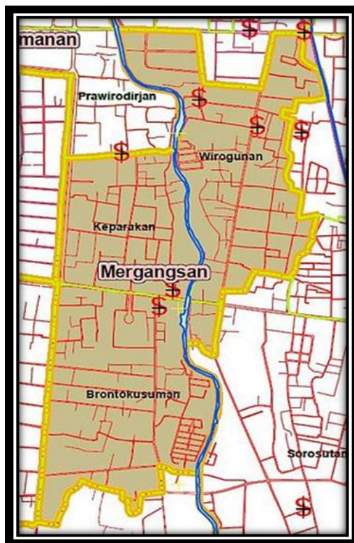
Gambar 2: Peta Kec. Mergangsan

Kampung Prowirotaman secara administratif termasuk wilayah kelurahan Brontokusuman, kecamatan Mergangsan, Kota Yogyakarta. Kampung yang memiliki luas wilayah sekitar 17 hektar, posisinya berada kurang lebih 5 kilometer dari pusat Kota Yogyakarta, atau 2 kilometer dari kawasan Keraton Ngayogyakarta Hadiningrat (Sumintarsih dan Ambar, 2014: 63).