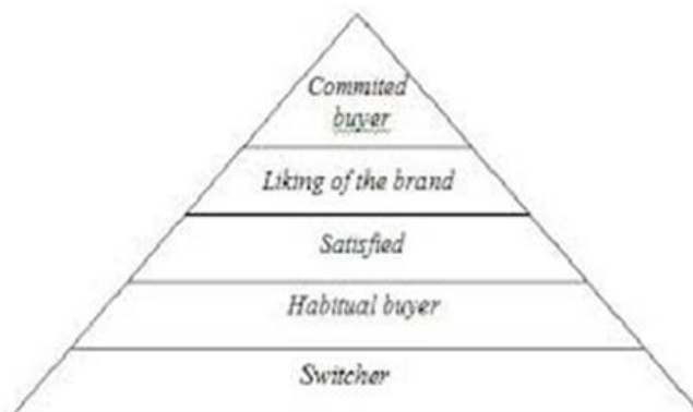
Gambar 3. Piramida Tingkat Loyalitas

Kelima tingkatan loyalitas diatas merupakan tingkatan yang berbentuk piramida seperti berikut ini: