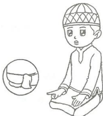
Tahiyat / Tasyahud Awal