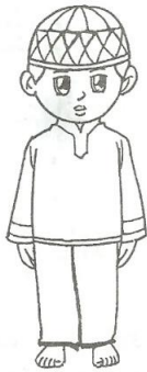
Bersiap hendak shalat (berniat)