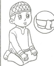
Duduk antara dua sujud