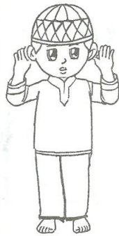
I'TIDAL (Membaca samiallahu....)