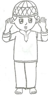
Takbiratul ihram "ALLAAHU AKBAR"