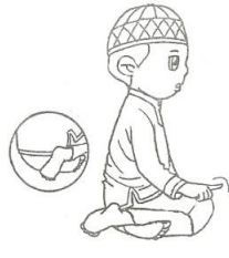
Tahiyat / Tasyahud Akhir