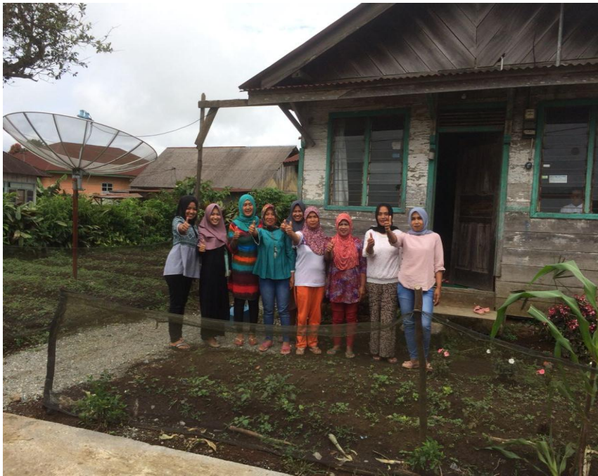
Gambar Dokumentasi pribadi saat wawancara dengan peserta PKH Kabupaten Kerinci..