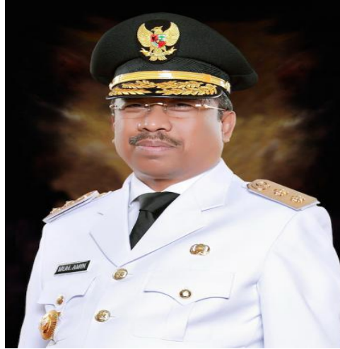
Gambar 2 Kandidat Wakil Gubernur Nusa Tenggara Barat