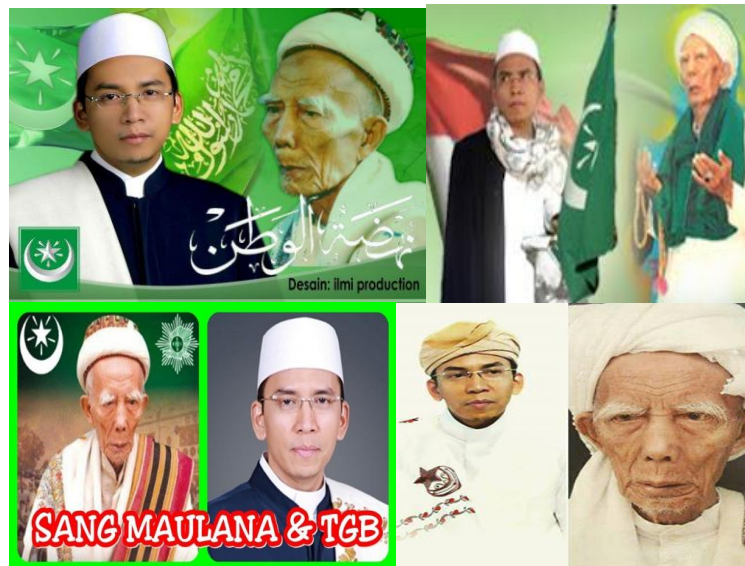
Gambar 3 Foto Syaikh Maulana dan Tuan Guru Bajang

mengatakan karismatik yang dimiliki sang kakek yakni Syaikh Maulana, merupakan hasil dari apa yang kemudian selama masa hidupnya penuh dengan sebuah perjuangan, hal yang mendasar menjadi faktor ketokohan yang dimilikinya adalah, mulai dari keterlibatan-keterlibatan sang kakek sebagai perintis dan penggerak sosial keagamaan di pulau Lombok dan Sumbawa, pada tahun 1946 sebagai pelopor penggempuran NICA di Selong Kabupaten Lombok Timur, dan pada tahun 1945 beliau adalah pelopor kemerdekaan di pulau Lombok. Atas beberapa jasa yang telah ia sumbangkan selama hidupnya sampai dengan wafatnya. Inilah yang menjadi faktor sebab akibat mengapa sampai saat ini ketokohan Syaikh Maulana sangat dikenang dan begitu bersejarah bagi masyarakat, sampai sebagian besar dari masyarakat mengkeramatkan keluarga keturunan Syaikh Maulana sebagai keluarga Nabi.