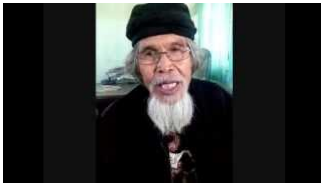
Gambar 5 Testimoni Seorang Tokoh Budayawan Di Youtube

Atas pernyataan sikap dukungan tersebut terlihat di beberapa tempat atau ruang publik strategis di Kabupaten Lombok Tengah dan Lombok Utara terdapat beberapa alat kampanye seperti baliho dan stiker yang memperlihatkan foto serta testimoni Lalu Mamiq Bayan menghimbau agar pada pemilukada 13 Mei 2013 untuk memilih pasangan kandidat TGB-Amin sebagai gubernur Nusa Tenggara Barat. Dalam salah satu media lain juga sebuah gambar visual serta testimoni Mamiq Bayan sebagai berikut.