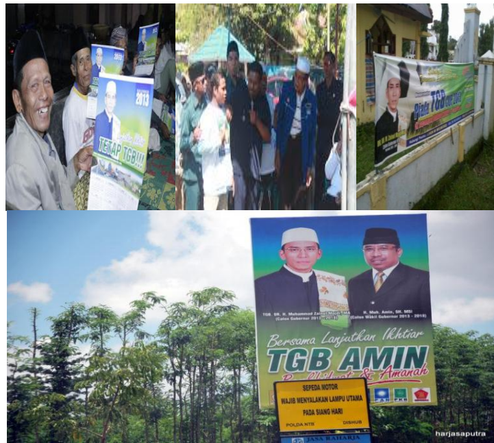
Gambar 9 Beberapa alat-praga kampanye TGB-Amin

Pada implementasinya penempatan dan pemasangan media atau alat-praga kampanye yang dilakukan tim, tentu akan berpengaruh pada tokoh-tokoh masyarakat yang menjadi panutan di masyarakat itu sendiri, efektifnya suatu penempatan alat-praga kampanye kemudian akan menjadi pertimbangan pemilih sehingga akan menghasilkan target yang memuaskan juga.