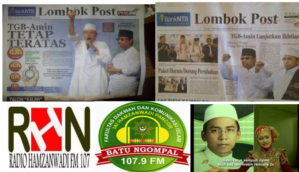
Gambar 8 Media Pendukung Kampanye TGB-Amin

http://rekammedia.akumassa.org/2013/02/25/tabuh-genderang-jelang-