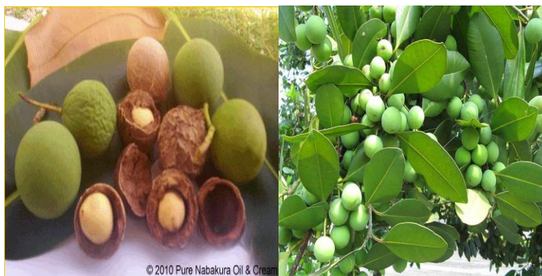
Gambar 2.3. Tanaman Nyamplung ( calophyllum inophyllum ) dan bijinya. (Budiman, 2017)

Minyak nyamplung memiliki nama ilmiah calophyllum inophyllum yang dihasilkan dari biji buah nyamplung. “ Calophyllum ” diambil dari bahasa Yunani yang berarti “daun yang indah”. Pohon nyamplung tingginya sekitar 25 m, bahkan terkadang mencapai 35 m. Diameter batangnya dapat mencapai 150 cm. Pada gambar 2.3 dibawah ini merupakan pohon nyamplung dapat tumbuh di daerah yang memiliki suhu hangat dengan curah hujan sekitar 1.000-5.000 mm. Pohon nyamplung dapat bertahan di daerah dengan kecepatan angin yang tinggi dan daerah payau.