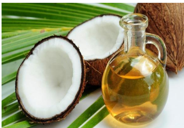
Gambar 2.4. Minyak kelapa (Budiman, 2017)

Pada gambar 2.4 di atas merupakan kelapa ( cocos nucifera ), tanaman dari genus cocos dan satu famili dengan kelapa sawit, merupakan salah satu yang minyak nya banyak diproduksi dari semua minyak nabati yang diproduksi dunia, yaitu hampir 20% dari total minyak nabati yang diproduksi. Tanaman ini banyak ditemukan di daerah tropis. Minyak kelapa diekstrak dari bagian kopra , daging bagian dalam tempurung kelapa yang dikeringkan. Kopra memiliki kandungan minyak sekitar 65%.