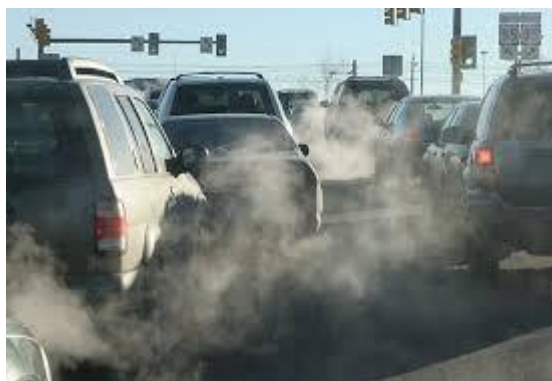
Gambar 2.2. Kendaraan dengan tingkat emisi tinggi (Budiman, 2017)

Meskipun demikian, sekitar tahun 1920-an, pembuat mesin diesel mengganti penggunaan bahan bakar dengan bahan bakar yang viskositasnya lebih rendah, yaitu petrodiesel atau bahan bakar fosil. Hampir semua industri petroleum memilih memproduksi bahan bakar fosil karena biaya produksinya jauh lebih murah dari pada bahan bakar dari biomassa dengan mengabaikan dampak polusi yang dihasilkan pada masa-masa mendatang. Perkembangan petrodiesel menyebabkan bahan bakar dari biomassa hampir dilupakan.