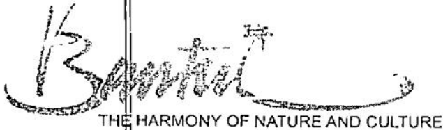
DWIAN HARTOMI AKTA PADMA ELDO