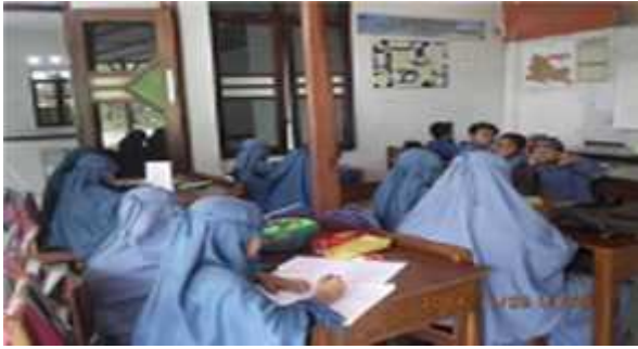
Kegiatan belajar mengajar