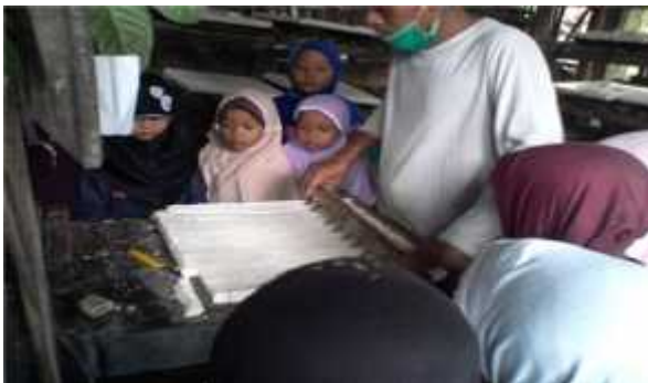
Kunjungan ke pabrik tahu