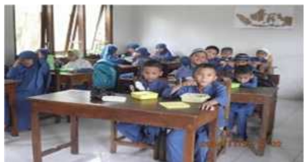
Makan siang bersama