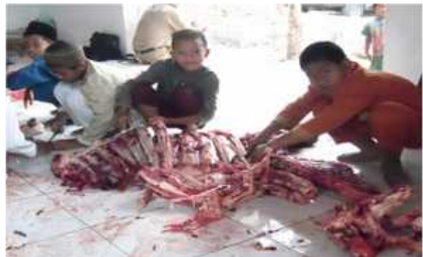
Penyembelihan hewan qurban