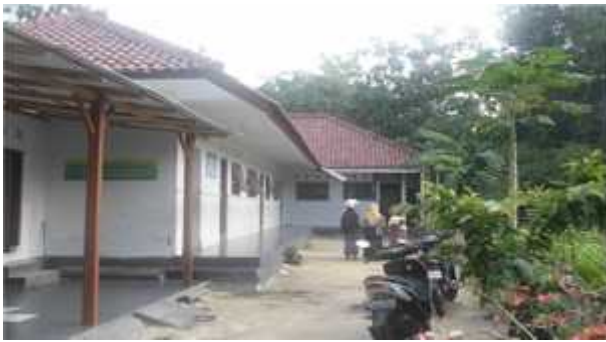
Gedung SDII Waladun Sholihun