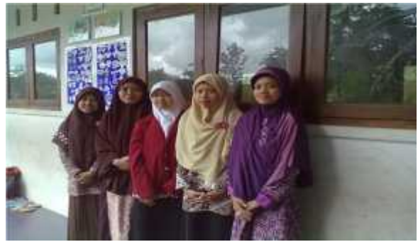
Dewan guru dan peneliti