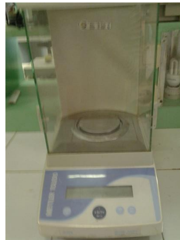
Ket : Timbangan digital