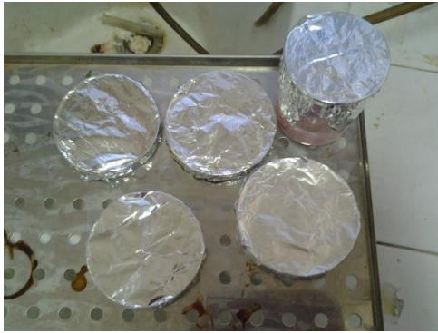
Ket : sampel resin akrilik yang sudah diberi perlakuan