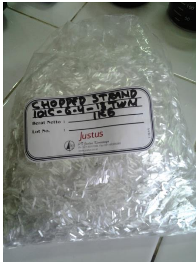
Ket : Serat kaca