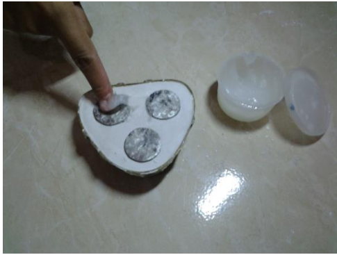
Ket : master model