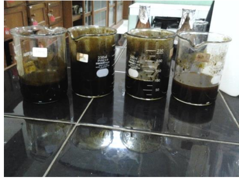
Ket : ekstrak teh hijau multi konsentrasi