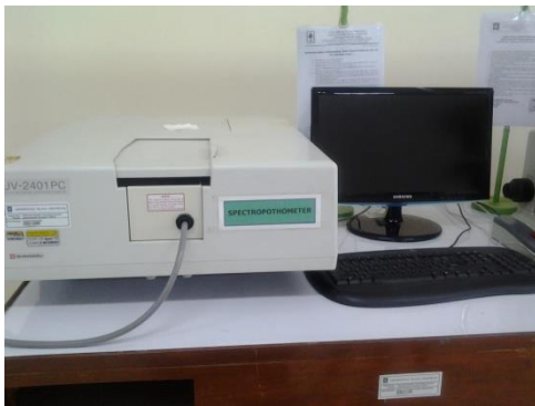
Ket : spektrofotometer