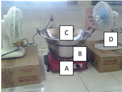
Ket : A : kompor listrik, B : panci, C : wajan, D : kipas angin