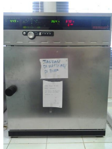
Ket : inkubator