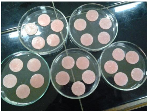
Ket : sampel resin akrilik