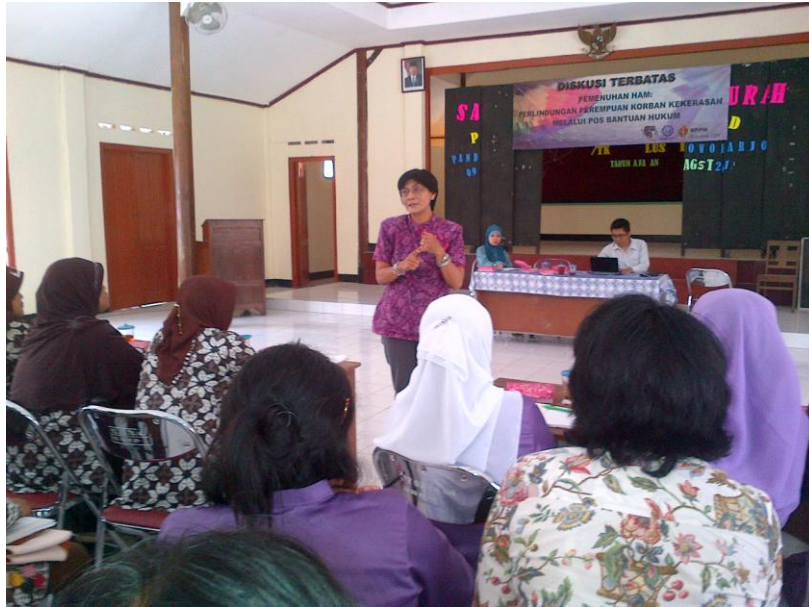
( Penyuluhan di Balai Desa Kepek, Gunung Kidul )