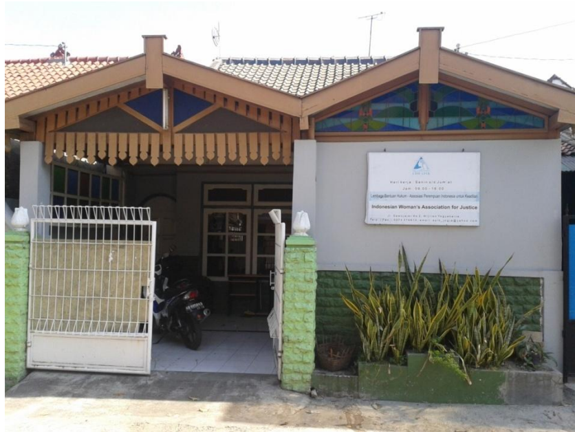
Foto Kantor LBH APIK YOGYAKARTA Jl. Sawojajar No 2 Wijilan Yogyakarta