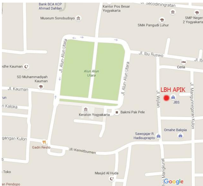
Denah lokasi kantor LBH APIK YOGYAKARTA