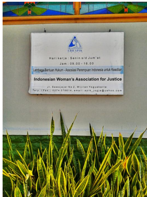
Foto : depan kantor LBH APIK YOGYAKARTA