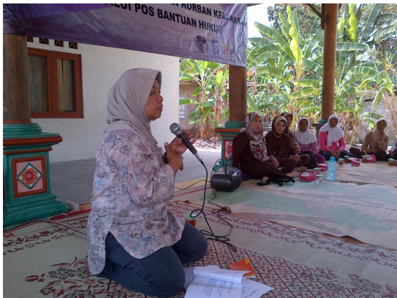
( Penyuluhan di Balai Desa Kepek, Gunung Kidul )