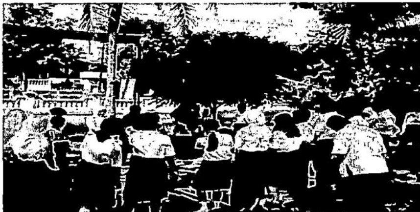
Gambar 3.2 Pelaksanaan FGD siswa SMP