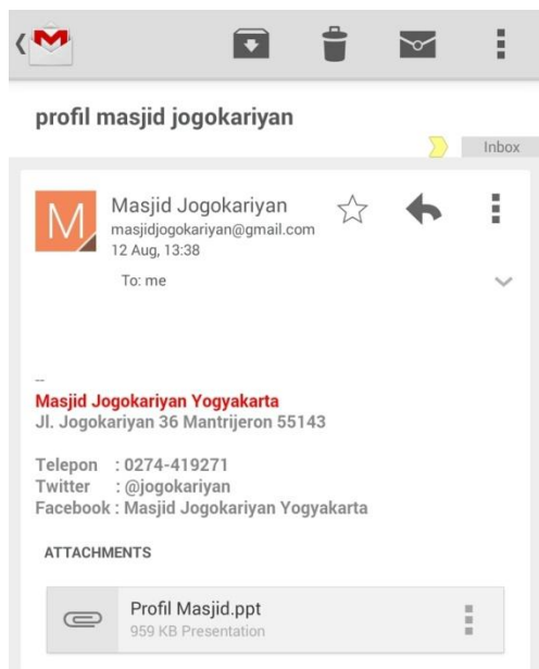
Gambar 1. Capture email Profil Masjid Jogokariyan