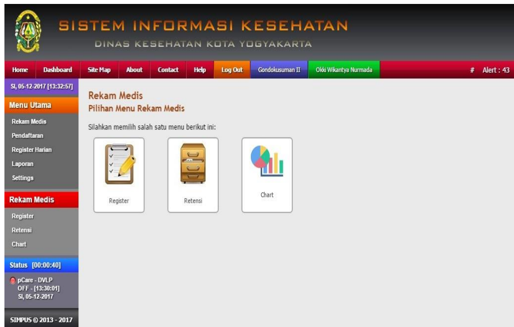
Gambar: 2.2 Menu Rekam Medis