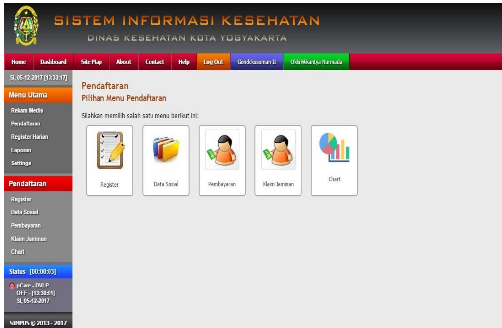
Gambar 2.4 Menu Pendaftaran

Pada menu pendaftaran di atas berisikan register, data sosial dan pembayaran. Di dalam menu pembayaran ini, pasien bisa menggunakan cara pembayarannya dengan menggunakan Asuransi Kesehatan atau Askes, Jaminan Kesehatan Puskesmas atau Jamkesmas atau Badan Penyelenggara Jaminan Sosial atau BPJS atau pasien tersebut membayar sendiri. Untuk menu pembayaran ini biasanya dipakai oleh bendahara atau kasir yang ada di puskesma Gondokusuman II tersebut.