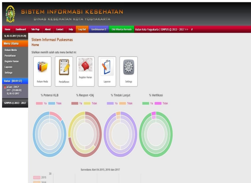
Gambar: 2.1 Menu Utama Rekam Medis

Pada menu utama Sistem Informasi Manajemen Puskesmas di dalamnya terdapat menu rekam medis, pendaftaran, register harian dan laporan. Setelah itu di dalam menu rekam medis terdapat menu register, seperti pada gambar dibawah ini.