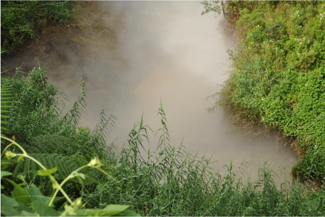
B. Kawah Sileri